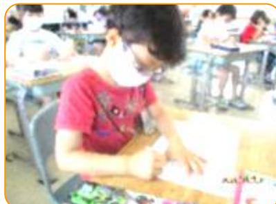
国語科:一字一字丁寧に書いています。