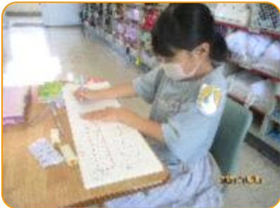
算数科:真剣に取り組んでいます。