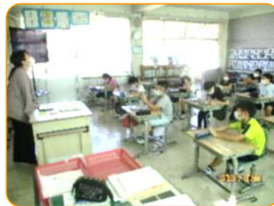
学活:学習発表会の話し合い