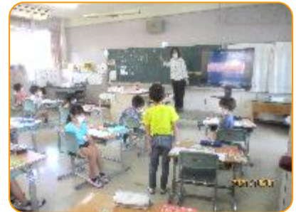
算数科:自分の考えをしっかりと発表しています。