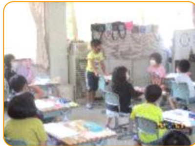
算数科:発表者の方を向いて聞いています。