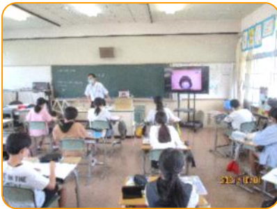
算数: 家からオンラインで参加しています