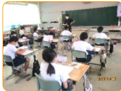
算数:まずは1人で考えてみましょう。