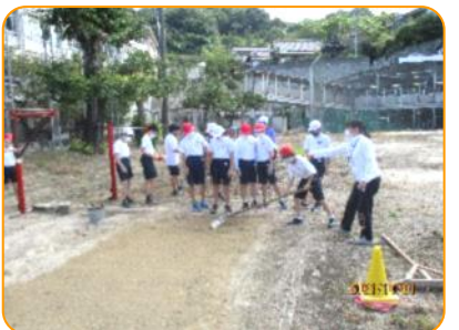
体育: 走り幅跳び 砂場の整地