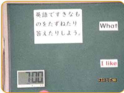
外国語活動:今日の外国語活動のめあて