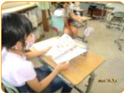
外国語活動:教科書で確認しています。