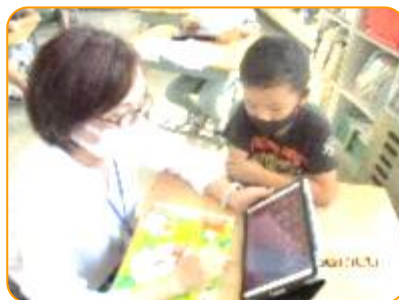
音楽科:先生に教えてもらっています。