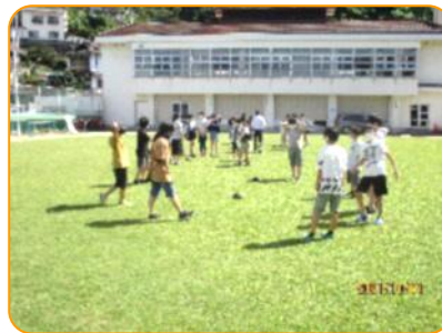
理科: 雲と天気 ちょっと広がって観察