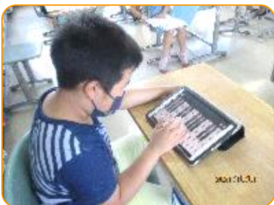
音楽科:タブレットで鍵盤練習