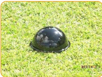
理科: 雲と天気 天気を調べる器具