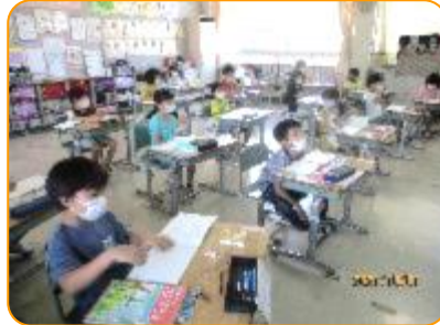
算数科:一生懸命聞いています。