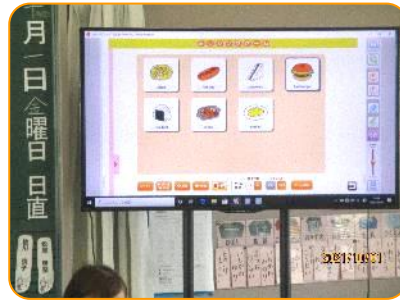
外国語活動:何が好きですか