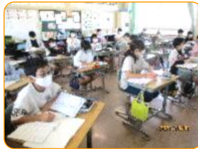
算数: 説明をしっかりと聞いています。