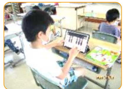
音楽科:上手に弾けています。