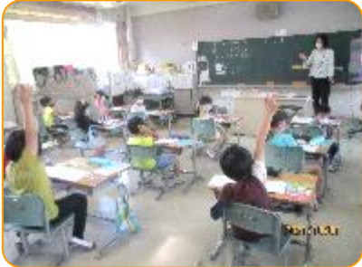
算数科:先生の質問に答えて発表します。