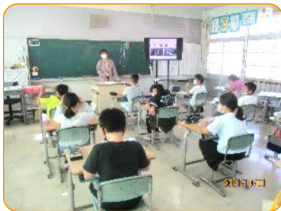
学活:学習発表会の話し合い