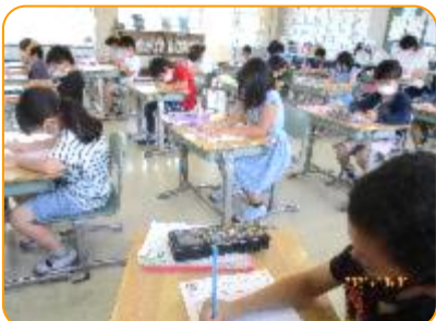
国語科:漢字プリントに取り組んでいます。