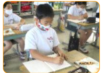
算数:一生懸命考えています。