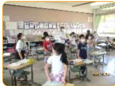
外国語活動:わかった人?