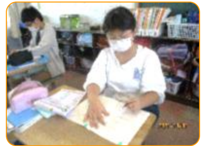
算数: 自分で問題に取り組みます。