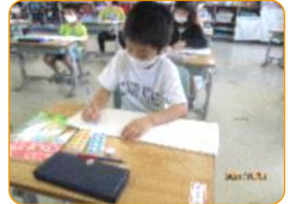
算数科:練習問題に取り組んでいます。