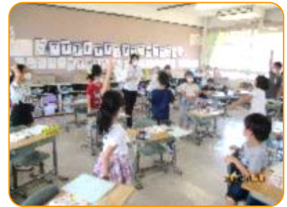
外国語活動:先生がヒントを出しています。