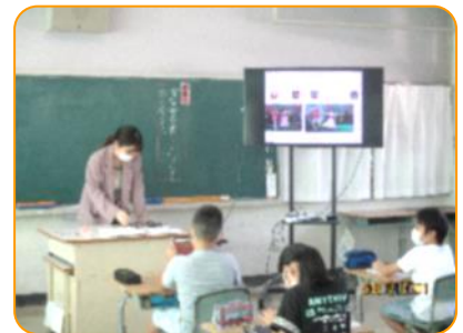
学活:学習発表会の話し合い