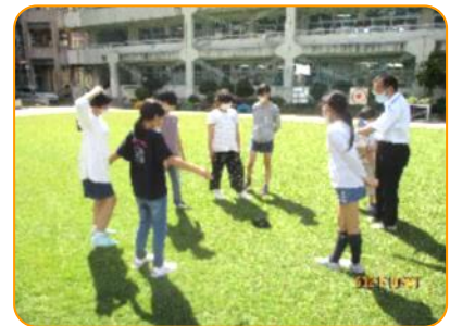
理科: 雲と天気 雲の割合を調べています。