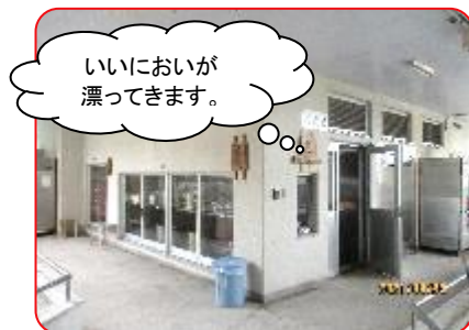
給食室からおいしそうなおいが…。