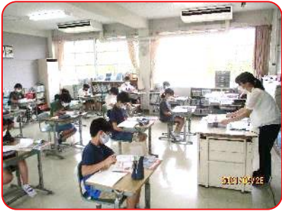
6年 社会科 室町時代