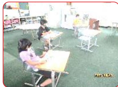
ひまわり 読書タイム