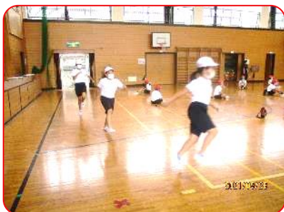
4年 体育科 スキップ 30秒間走