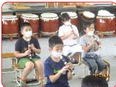
3年 音楽科 あの雲のように リコーダーの運指練習(吹けないのが残念)