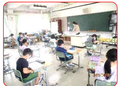
3年 国語科 新出漢字の練習