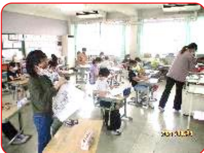
4年生 先生がプリントを配布しています。