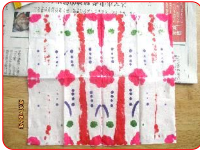
2年 図工科「いろいろもよう」 素敵な模様ができました。