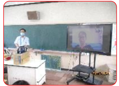
5年 国語科 教室の子ども達も顔が見れて喜んでいました。