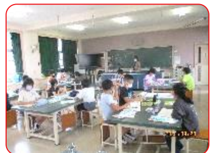
4年 理科 空気と水