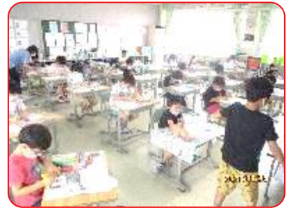
2年 図工科「いろいろもよう」 夢中になって取り組んでいます。