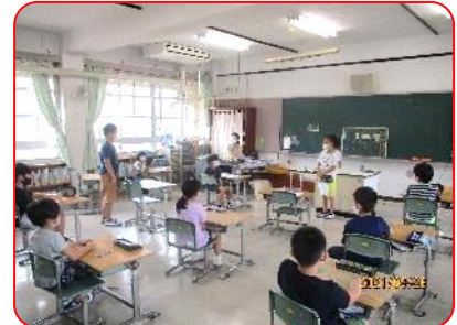
3年生 朝の会のスピーチ