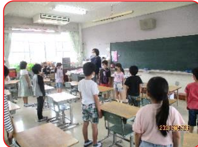
2年生 「今から朝の会を始めます」