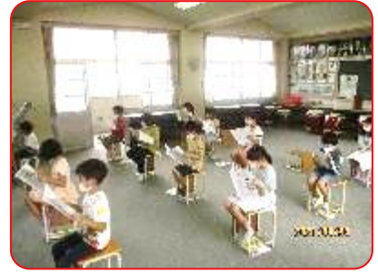
1年 国語科「大きなかぶ」 役割読みをしています。