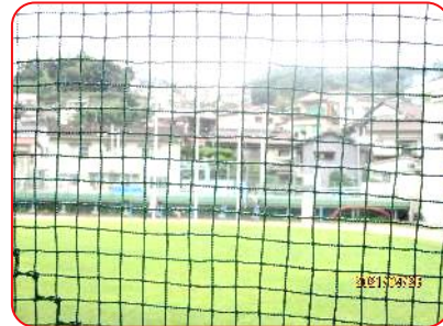
旗の掲揚（ネット越し）