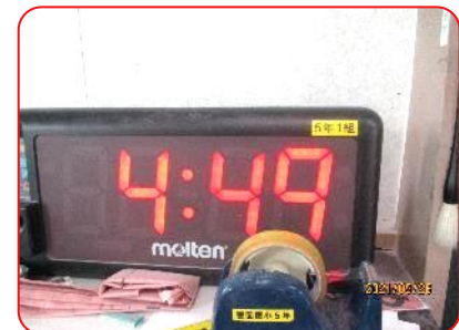
5年生 スキルタイムは5分間です。