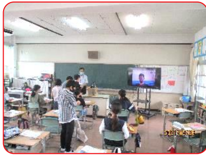
5年 国語科 欠席してもオンラインで参加しています。