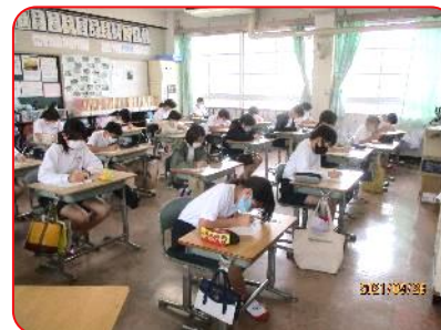
5年生 計算のスキルタイム