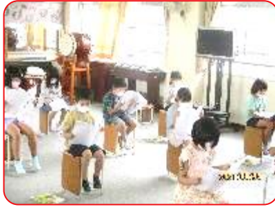
1年 国語科「大きなかぶ」 学習発表会でも発表します。