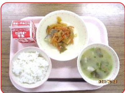
広島レモン煮、五目みそ汁