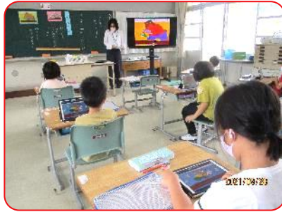
1年 道徳科「はしの上のオオカミ」 先生がお話の続きを説明しています。