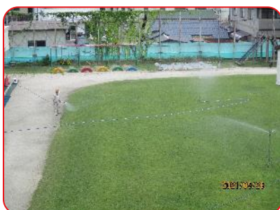
今日も芝生の管理, ありがとうございます。