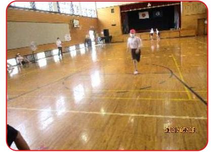
6年 体育科 ダッシュリレー