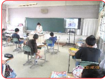
6年 社会科 室町時代