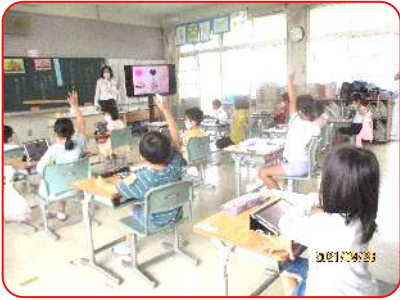
1年 道徳科「はしの上のオオカミ」 手をしっかり挙げて、発表します。