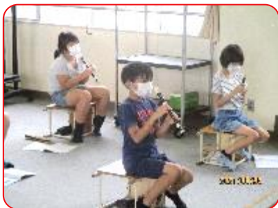
3年 音楽科 あの雲のように リコーダーの運指練習(吹けないのが残念)