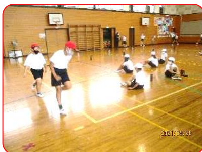
4年 体育科 スキップ 30秒間走