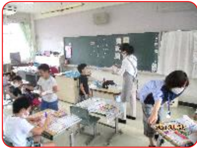
2年 図工科「いろいろもよう」 思い思いの模様をマジックで描いています。