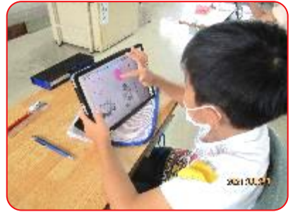
1年 道徳科「はしの上のオオカミ」 オオカミの気持ちを色で表しています。