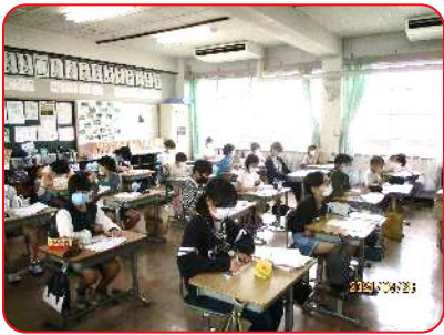
5年 国語科 漢字の小テストをしています。