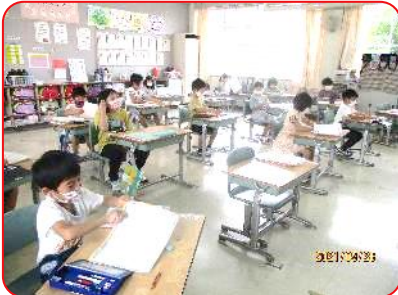
1年生 配布されたプリントを袋に入れていきます。