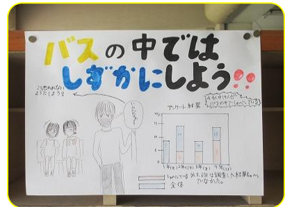
子供たちが作成したポスター