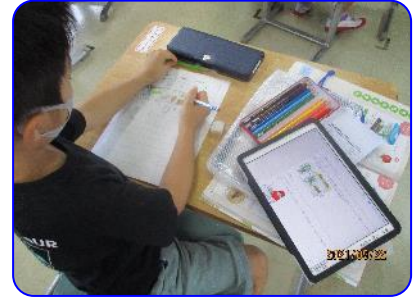
1年生生活科 タブレット検索で調べ学習