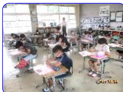
4年生道徳科「ぼくらだってオーケストラ」 登場人物の気持ちを考えます。