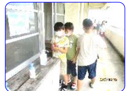
休憩時間後は 手を洗おう