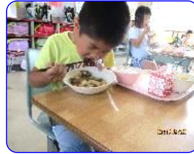
1年生 一生けんめい食べてます