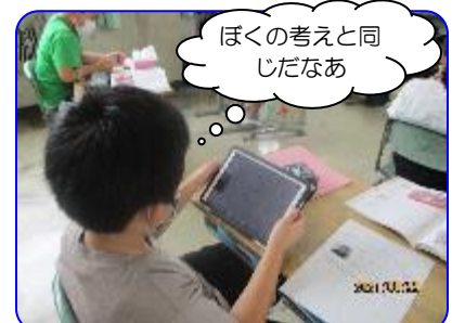
4年生道徳科「ぼくらだってオーケストラ」 友だちの考えをタブレットで交流しています。