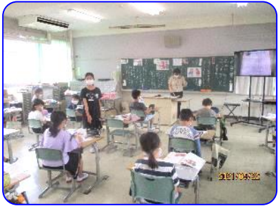
4年生道徳科「ぼくらだってオーケストラ」 「友だち」とは(自分の考えの発表)