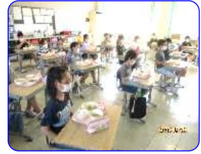
いただきますの前に「よい姿勢」