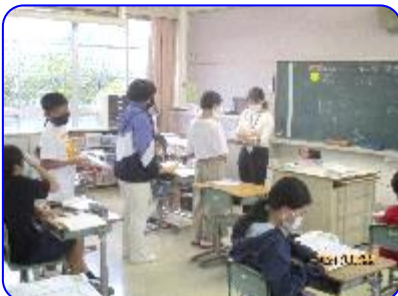
6年生 算数科 比の値の学習 練習問題を先生が確認しています