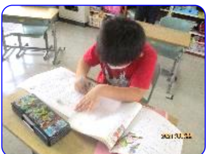
3年生道徳科「なかよしだから」 学習のふり返り