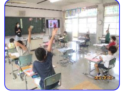
3年生道徳科「なかよしだから」 積極的に発表する子ども達