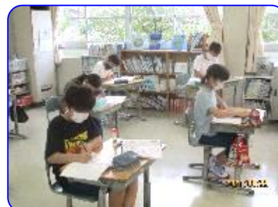
6年生 算数科 比の値の学習 練習問題に取り組んでいます。