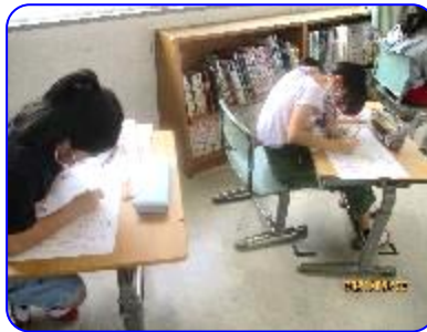
3年生道徳科「なかよしだから」 ワークシートに自分の考えを書いています