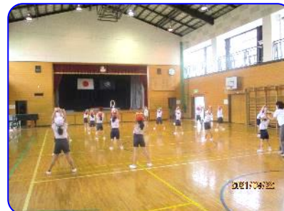
2年生 体育科 先生と体ほぐしの運動