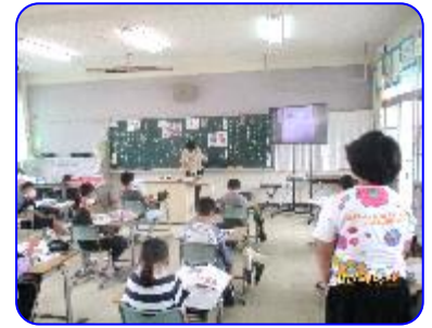
4年生道徳科「ぼくらだってオーケストラ」 友だちがいて嬉しかったことを発表しています。