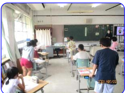
3年生道徳科「なかよしだから」 自分の考えを述べ合い、深めています。