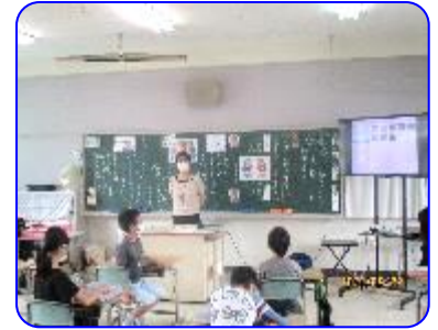
4年生道徳科「ぼくらだってオーケストラ」 先生がまとめの話をしています。