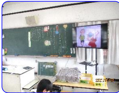
3年生道徳科「なかよしだから」 ICT 効果的に活用