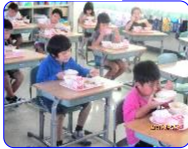
2年生 おいしそうに食べています。