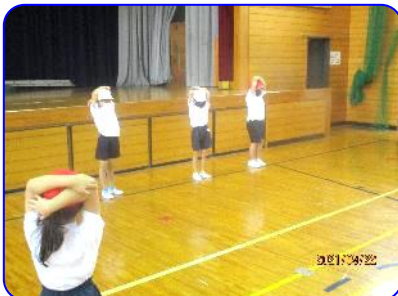
2年生体育科 体育係の準備運動