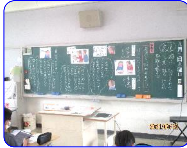
4年生道徳科「ぼくらだってオーケストラ」 子ども達の意見をまとめた板書