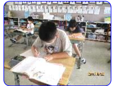
3年生道徳科「なかよしだから」 ワークシートに自分の考えを書いています