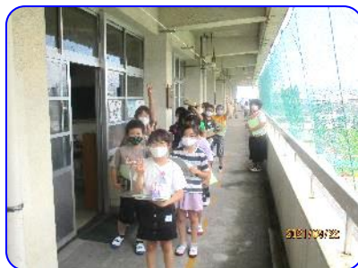
静かに並んでピース