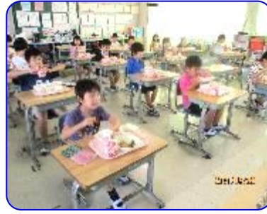
おいしそうに食べています。