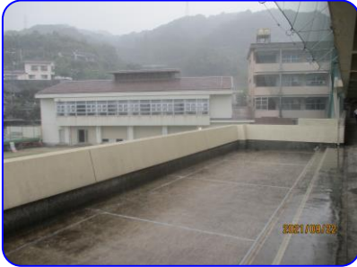
登校後は土砂降りの雨が降りました。