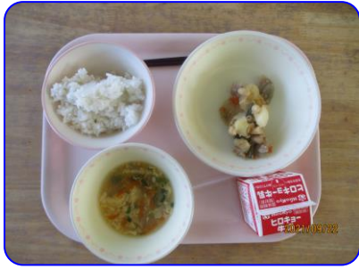
まごわやさしい煮, かきたま汁