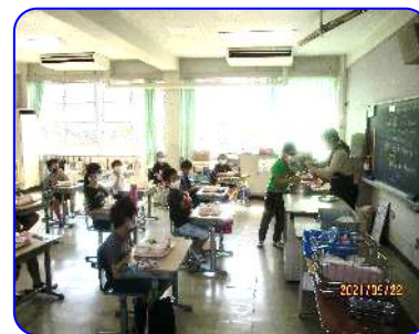
4年生 お代わり風景