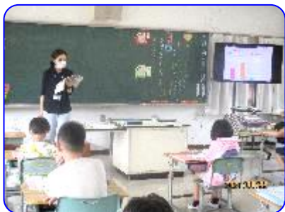
3年生道徳科「なかよしだから」 先生の範読