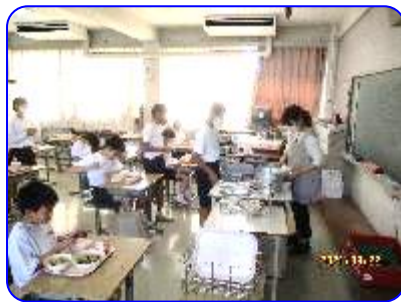
6年生 お代わり風景