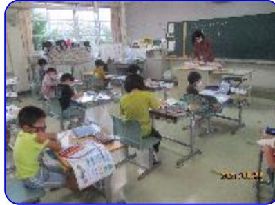
1年生生活科 タブレット検索で調べ学習