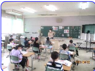
4年生道徳科「ぼくらだってオーケストラ」