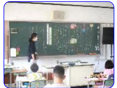
3年生道徳科「なかよしだから」 先生のまとめのお話