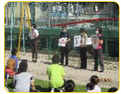
全体指導 1「おはしも」