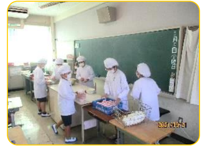
自分の役割を静かに行っています。