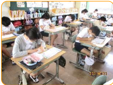
5年生 漢字の小テスト