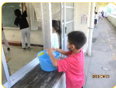
給食前に、机の上を拭きます 1