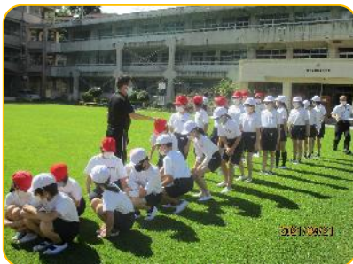
5年生 体育館から避難