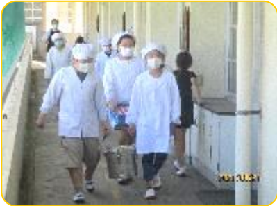
思い食管も協力して運びます