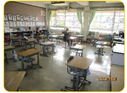
3年生 給食準備中 教室はとても静かです