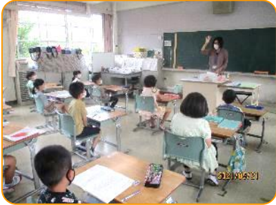
1年生 避難訓練の説明