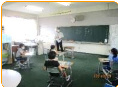
ひまわり 避難訓練の説明