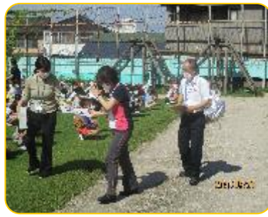
教頭先生に避難報告