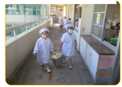
並んで給食室に行きます 1