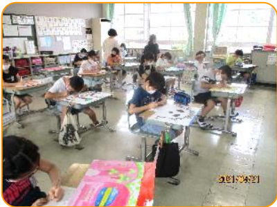
4年生 図画作品の画題表書き