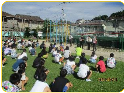
全体指導 2 ソーシャルディスタンスに気を付けています