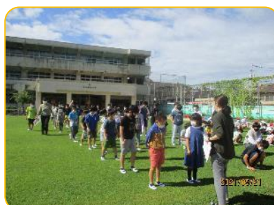
3年生 間をあけて整列