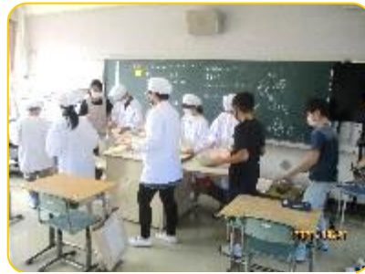
6年生 黙って配膳しています