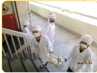
階段も協力して運んでいます。