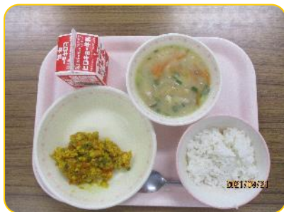
かぼちゃのそぼろ飯, 月見汁