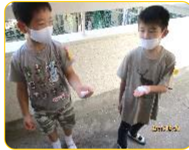
手に石鹸を付けて手洗いに行きます