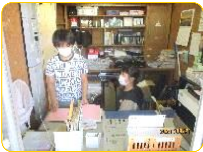
給食放送の打合せ