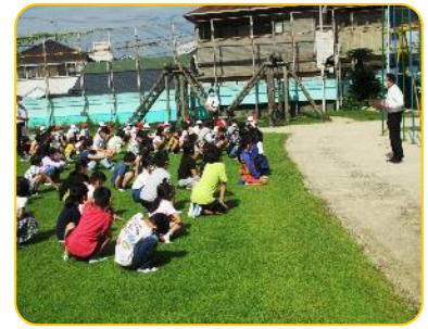
全体指導 4 校長先生のお話