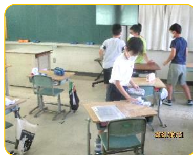
給食前に、机の上を拭きます 2