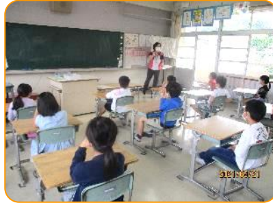
2年 給食当番の確認