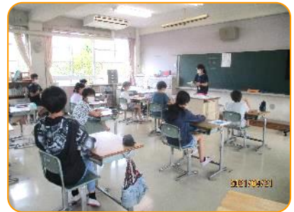
6年生 避難訓練の説明