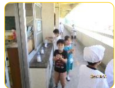
手荒の後のアルコール消毒