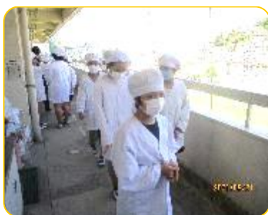
並んで給食室に行きます 2