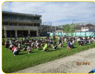
全体指導 3 静かに聞く様子