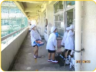
協力して食器を運んでいます。