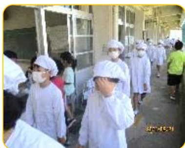
並んで給食室に行きます 1