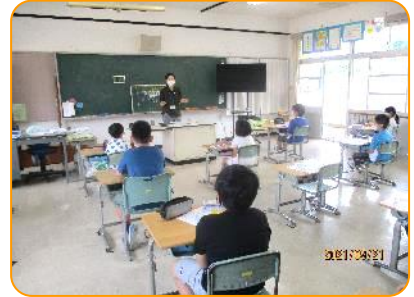
3年生 避難訓練の説明