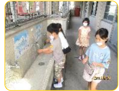
給食前にしっかり洗います