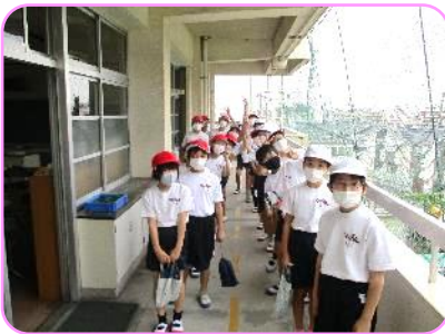
5年 体育科 今から体育です。