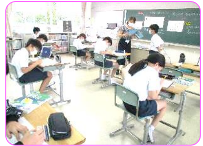
6年算数科 先生に確認してもらっています。