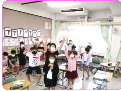
3年 休憩時間 全員そろってハイ, チーズ2