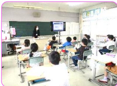
2年 算数科 筆算(引算)の復習 どうやって計算するのだけ?