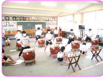
6年 総合 渦潮太鼓の練習風景 2