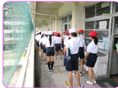
5年 体育科 静かに整列