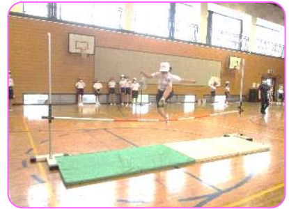
4年 体育科 走り高跳びの練習