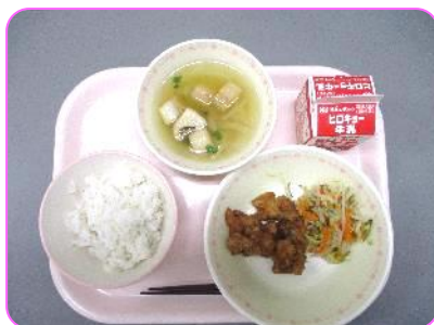
今日の献立 麦ご飯、豚肉のくわ焼き、爽やか和え、すまし汁