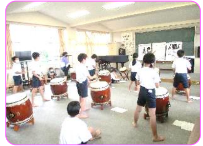
6年 総合 渦潮太鼓の練習風景 3。