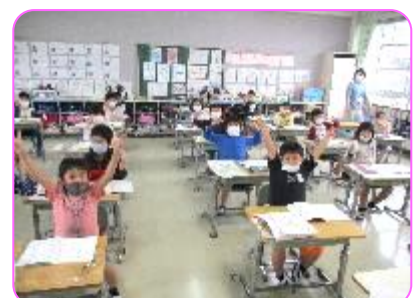
2年 もう一度、ハイチーズ