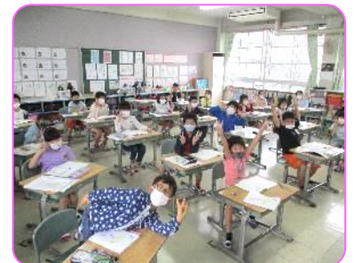
2年 授業の前にハイチーズ 1