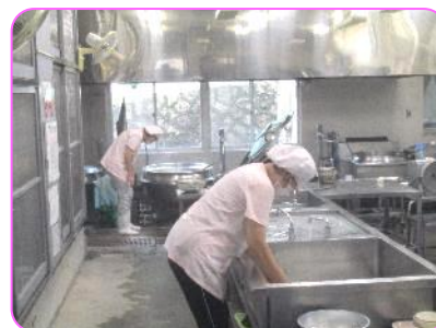
給食先生、毎日ありがとうございます。