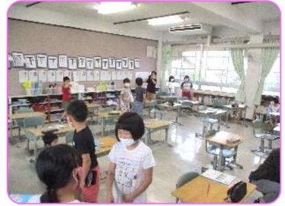
3年 授業が終わって, くつろいでます