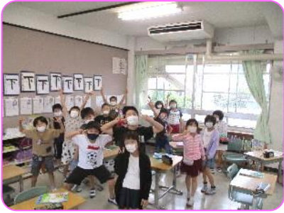
3年 休憩時間 ひょうきんポーズ