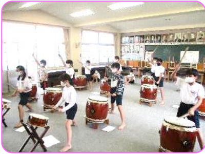
6年 総合 渦潮太鼓の練習をはじめました。