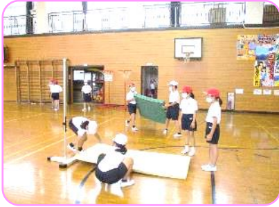
4年 体育科 走り高跳びの準備