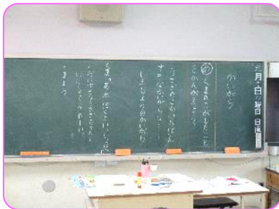
1年 国語科 「かいがら」の板書