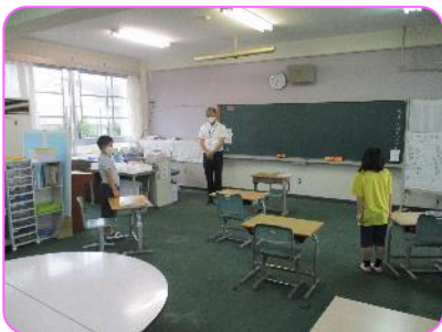
ひまわり 授業のあいさつ「姿勢！」