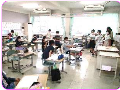
4年 授業と授業の合間