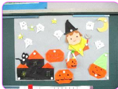
ひまわり ハロウィーンの飾りが完成