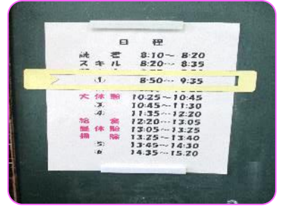
ひまわり 今日の予定表で確認しています。