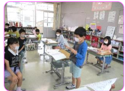
1年 国語科 自分の意見をしっかり発表で 伝えていました。