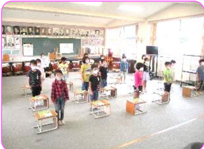
1年 音楽科 「今から音楽の授業を始めます。姿勢、礼。」