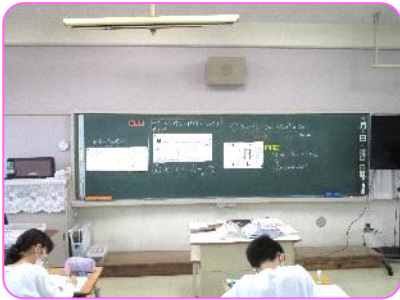
6年 算数科 角柱の体積の求め方