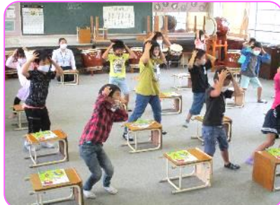
1年 音楽科 チェッチェッコリを踊ってます