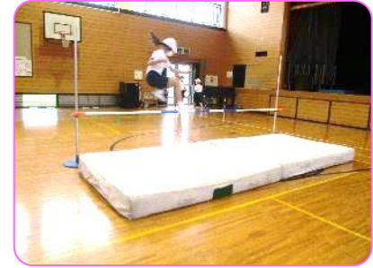
4年 体育科 70cmに挑戦