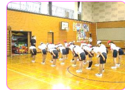
5年 体育科 規律正しい挨拶