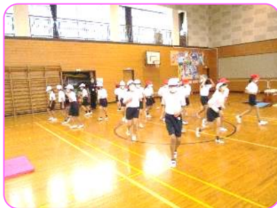
5年 体育科 体操体形に 開け! 123