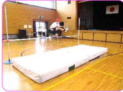
4年 体育科 走り高跳び 70cmに挑戦