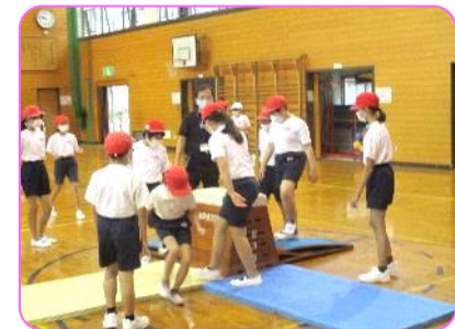
5年 体育科 跳び箱の準備