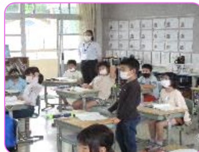
2年 算数科 筆算(引算) 計算の仕方を説明しています。