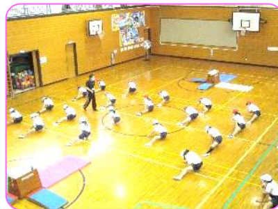
5年 準備体操の様子