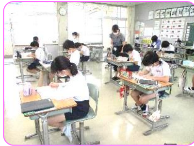
6年 算数科 自力解決の様子