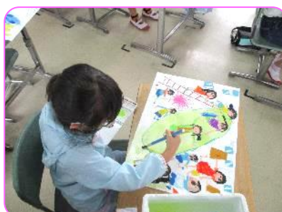
2年 図画工作科 あと少しで完成!