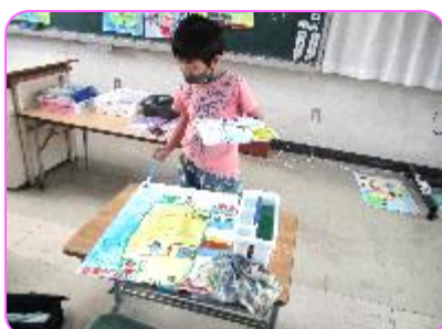
2年 図画工作科 今日で完成だ!