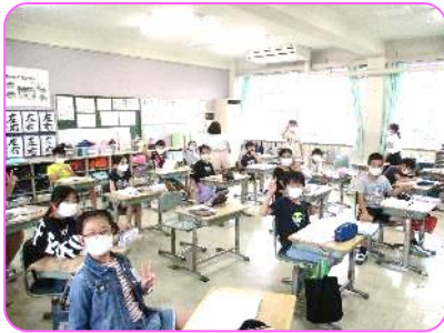
4年 休憩時間 はにかみながらのピース