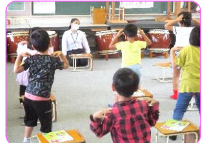
1年 音楽科 教員養成塾の先生に踊りを見てもらっています。