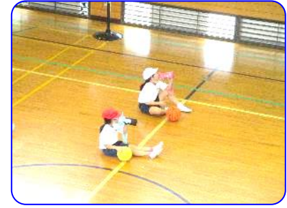
2年生 体育科 ちょっと休憩(水分補給)