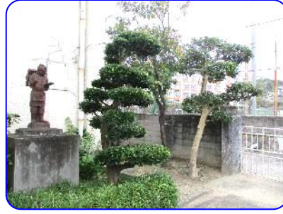
きれいに剪定された樹木