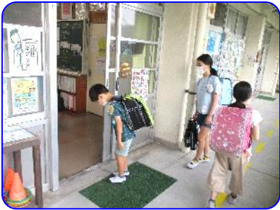
「先生方、おはようございます」