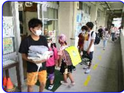
続々と、子ども達が登校してきます。 6年生は旗の掲揚準備をしています。