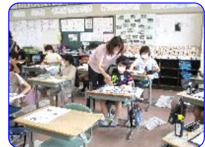
5年生国語科書写「成長」