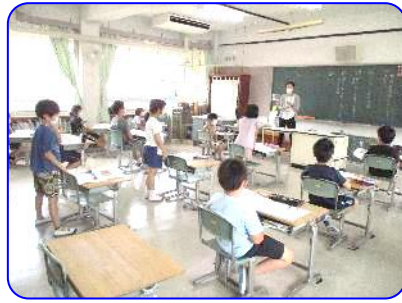
3年生国語科「サーカスのライオン」 自分がまとめたことを発表しています①