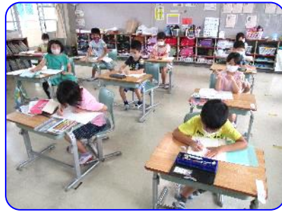
1年生国語科 ノートに練習しています。