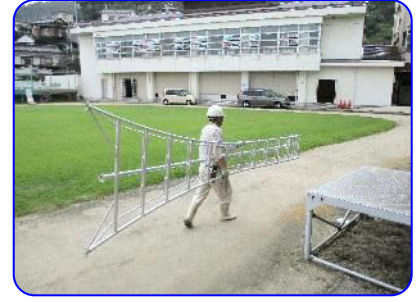
剪定ありがとうございました。