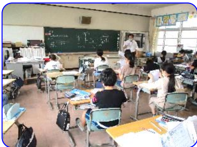
5年生算数科 最小公倍数の問題