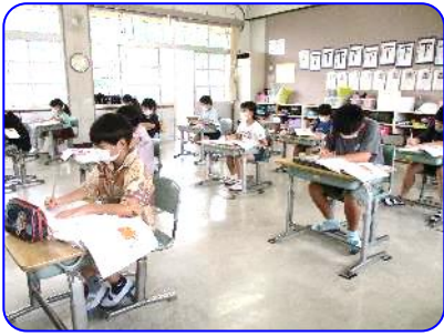
3年生国語科「サーカスのライオン」 自分で内容をまとめています