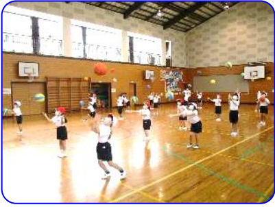
2年生体育科 ボールをキャッチ!