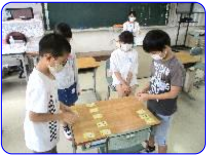
レクリエーションクラブ 百人一首