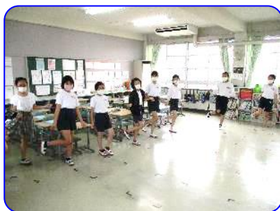
一輪車・ダンスクラブ Nijyuのダンス練習