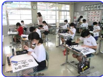
6年生 国語科書写「中秋の名月」