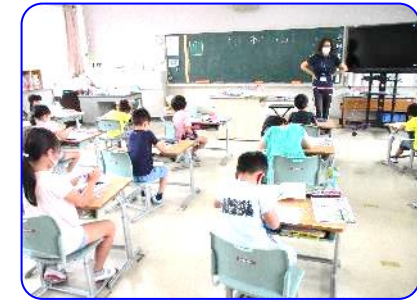
1年生国語科 もう一度気を付けて練習