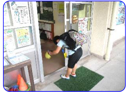
帽子をとって、気持ちのよい挨拶をしています