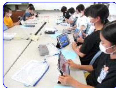
パソコン・タブレットクラブ タブレットアプリ試しています