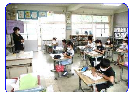
4年生算数科 計算しています。