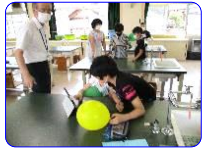
科学クラブ 静電気でくっつけよう