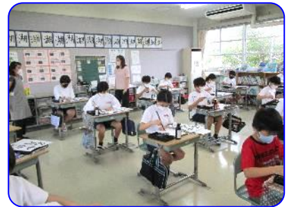
6年生 国語科書写 静かに黙々と書く子ども達