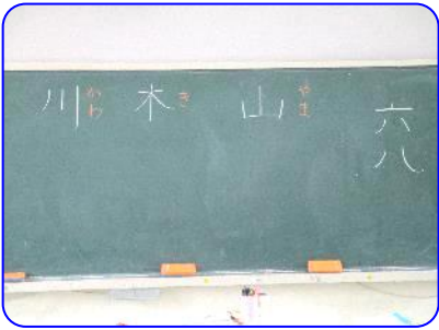
1年生国語科 新しい漢字の練習