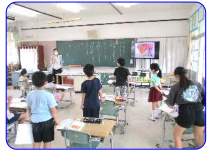
3年生国語科「サーカスのライオン」 自分がまとめたことを発表しています②