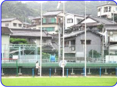
突然の雨で旗降ろし