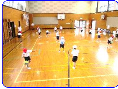
2年生体育科 何回つけるかな