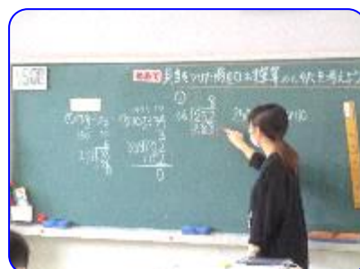
4年生算数科 3桁÷2桁筆算 商の立て方の説明