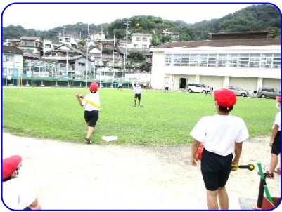
バドミントン・野球クラブ ナイスバッティング