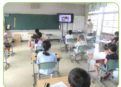
画面を見入る子ども達