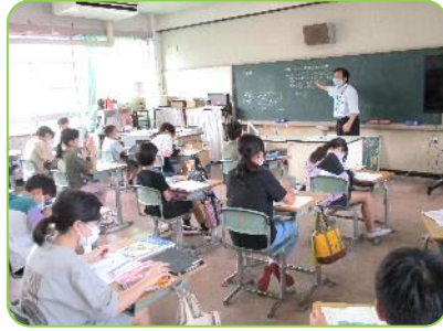
5年生算数科「偶数と奇数」 この数字はどっちかな