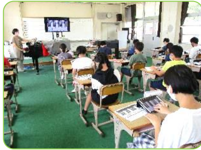
6年音楽科乗入れ授業 タブレットでピアノ練習