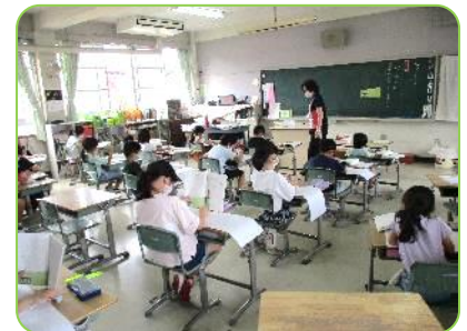
2年生国語科「ニャーゴ」の学習