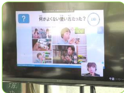
NTT Docomo 広島からリモート