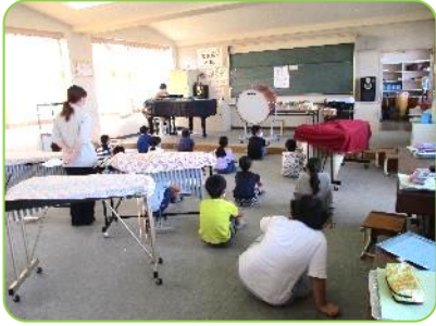
4年生音楽科 乗入れ授業「茶色の小瓶」