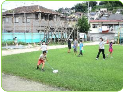
3年生 理科「こん虫」 虫, 取ったぞー