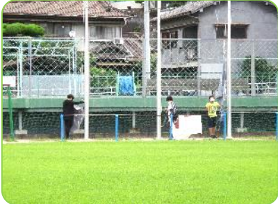
毎朝、国旗・市旗・校章旗を掲揚する6年生