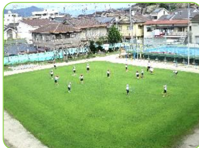
1年生 体育科 フラフープで体力づくり