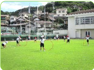
1年生 体育科 フラフープで体力づくり