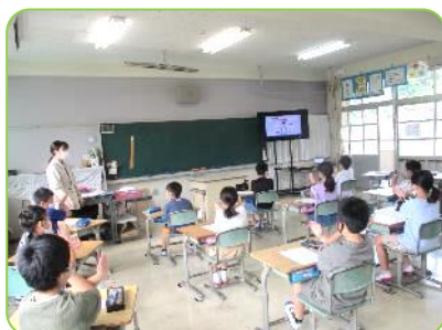
画面を見入る子ども達