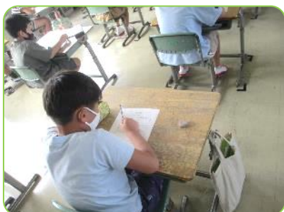
ケイタイ・スマホ教室のふり返りを書いている様子