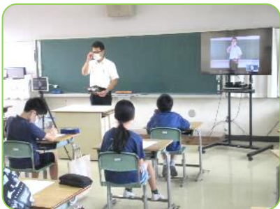
呉警察署 育成官さんのお話