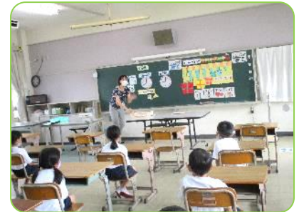
睡眠列車だ、ゴーゴーゴー!