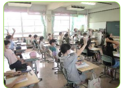
リモートの質問に答える子ども達