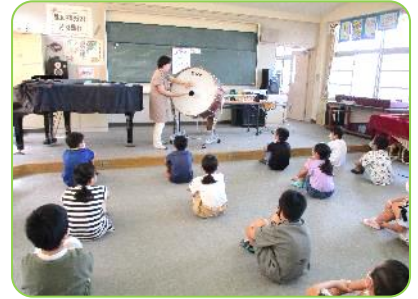
4年生音楽科 乗入れ授業「茶色の小瓶」