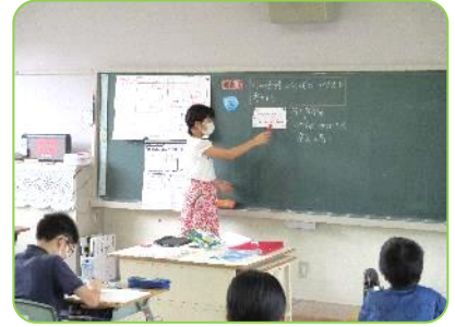
6年生「円」 面積の公式の作り方を考えよう