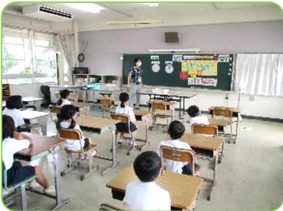
睡眠の大切さを学習しています。