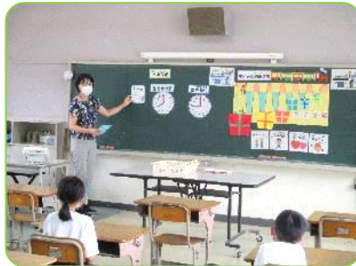
よい睡眠をとるためには、何が大切かな？