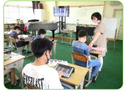
6年音楽科乗入れ授業 タブレットで自分の曲作り