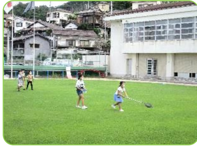
3年生 理科「こん虫」 それっ!