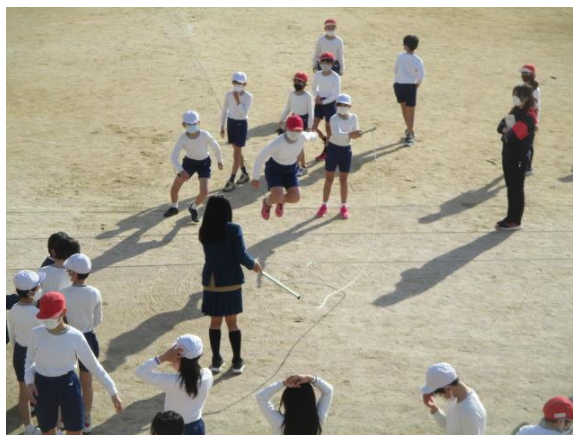
くれチャレンジマッチに挑戦していた4年生