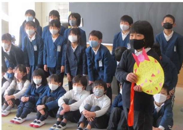
6年生への感謝の言葉を撮影していた3年生