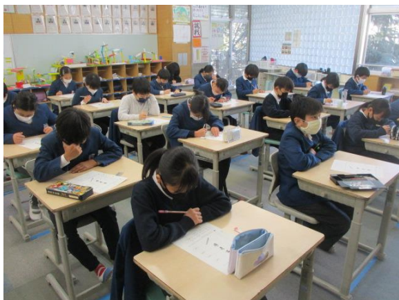
音楽で鑑賞の学習を行っていた5年生