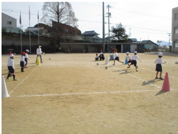
ラインサッカーを楽しんでいた1年生