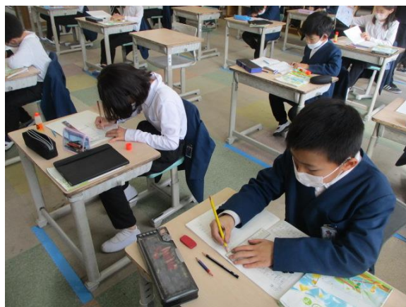
少数のたし算の練習問題を行っていました