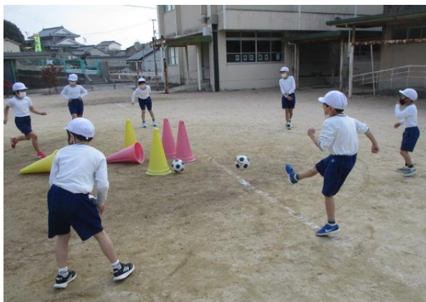
楽しみながらサッカーのキック練習を行う2年生