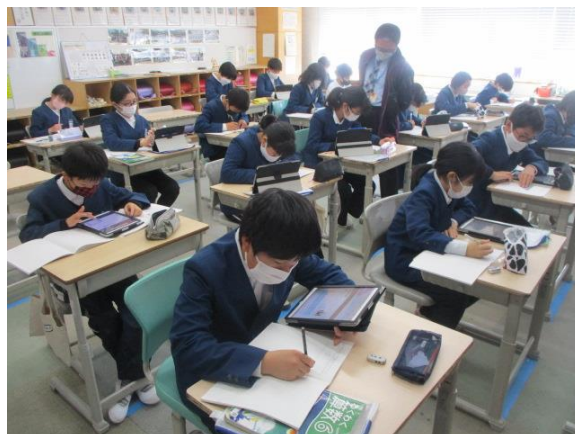
算数で難しい問題をしっかり考えていた6年生