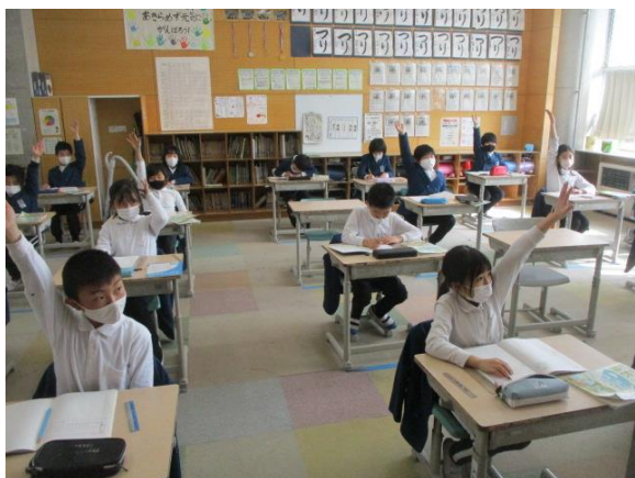
算数の授業観察で意欲的に発表していた3年2組