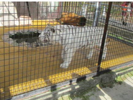
ホワイトタイガー登場！