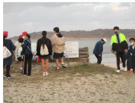
気持ちの良い朝です