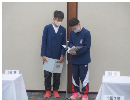
しっかり食べて楽しい2日目に！