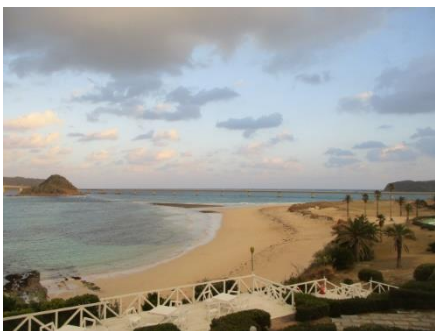
朝食後に浜辺の散策