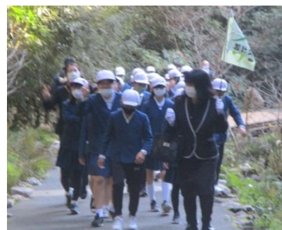
洞窟に入る前に記念撮影