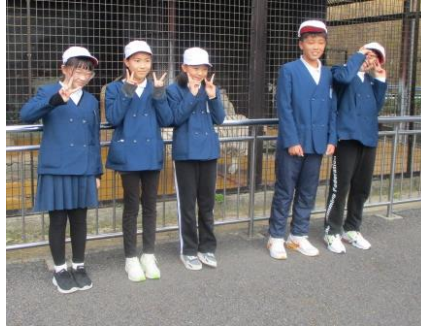
代表児童 いただきます