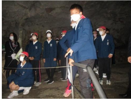
上を見てください