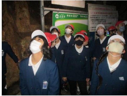
マリア観音像です