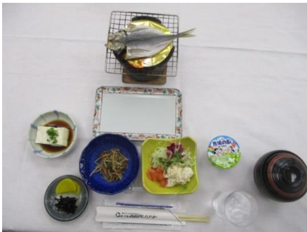
焼き魚は美味しかったです