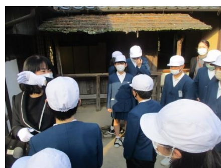
松下村塾前で記念撮影