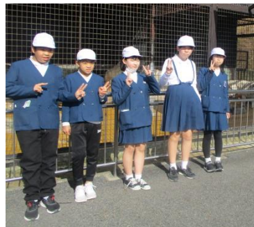
ホワイトタイガーと記念撮影