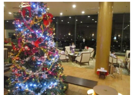
今日の振り返りをしましょう