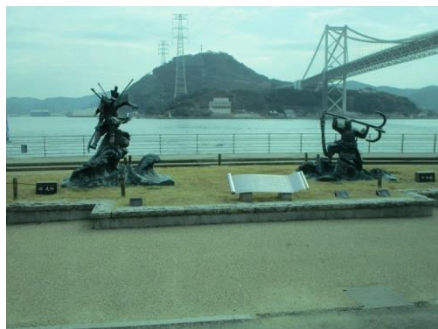
下関に到着しました