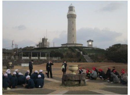
代表児童 よろしくお願ひします