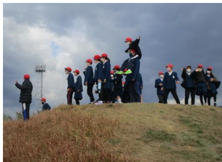
古墳の上は気持ち良かったです