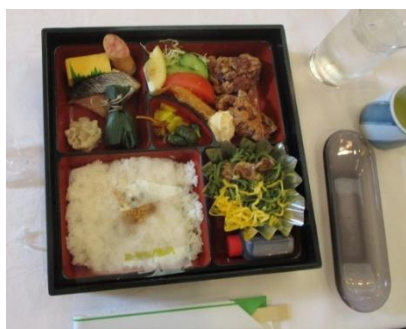
昼食のお弁当です