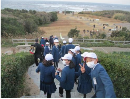
風が強かったが気持ち良かったです