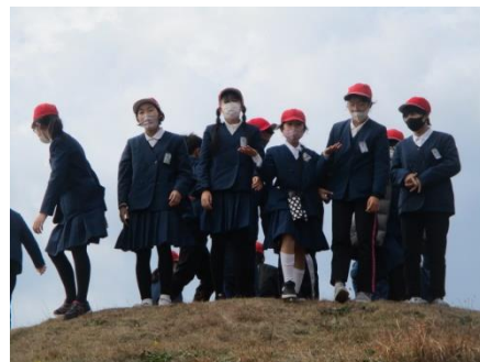
古代の歴史を学びました