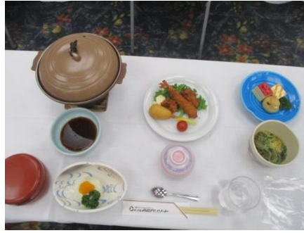
夕食のメニューです