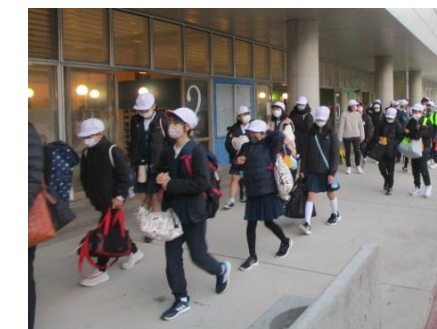
気を付けていってらっしゃい