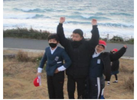
夕暮れの角島灯台、良かったです