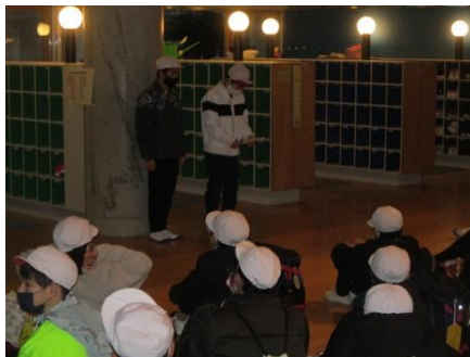
学校を出発します