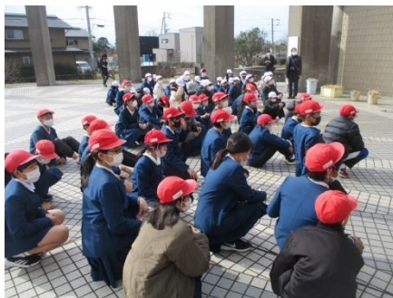
最初の見学場所「下関考古博物館」