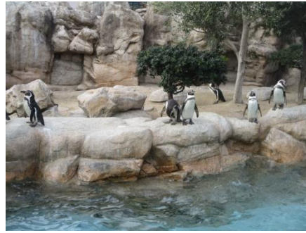
クッキーを買おうかな