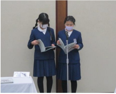
代表児童 いただきます