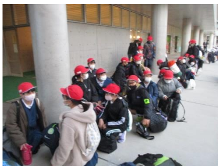
気持ちが昂ります