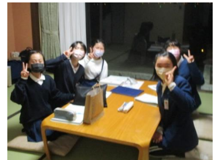
楽しみな夕食です