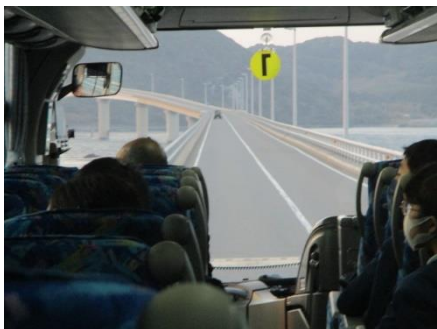
角島大橋を走行します