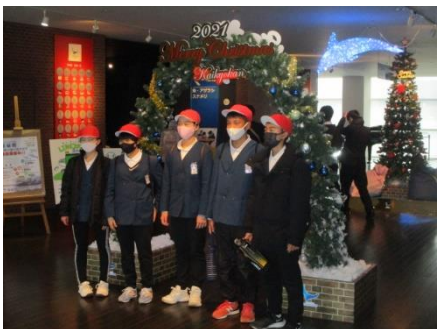
クリスマスバージョンの撮影場所