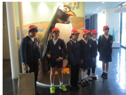
ペンギン館を見学します