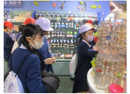
女子はキーホルダーが人気でした