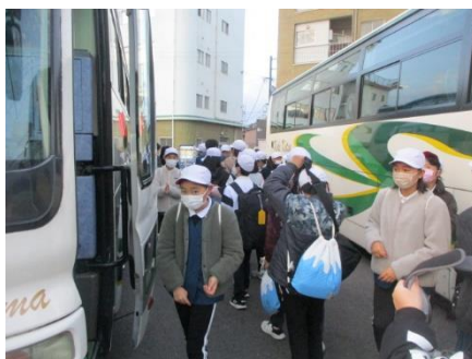
気持ちが昂ります