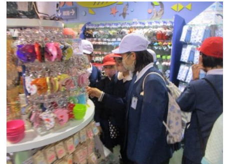
女子はキーホルダーが人気でした