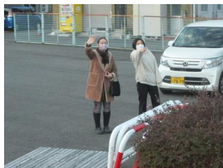
気を付けていってらっしゃい