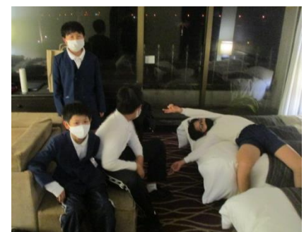
テンション上がっていました