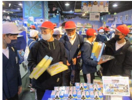
クッキーを買おうかな