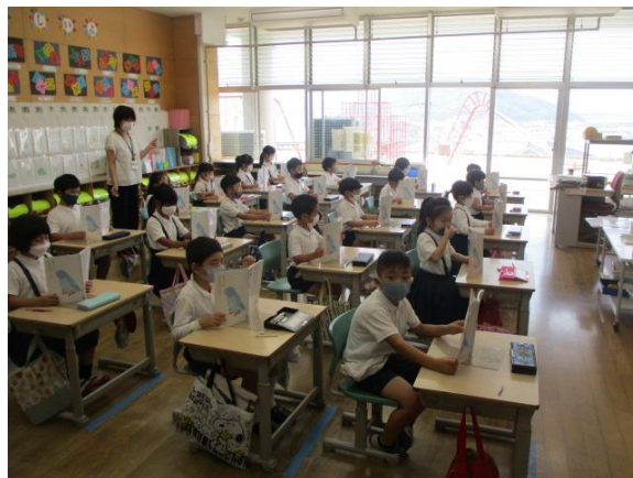
国語の音読を行っていた1年生