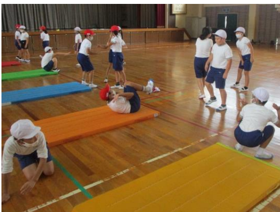
マット運動の練習をしていた4年生