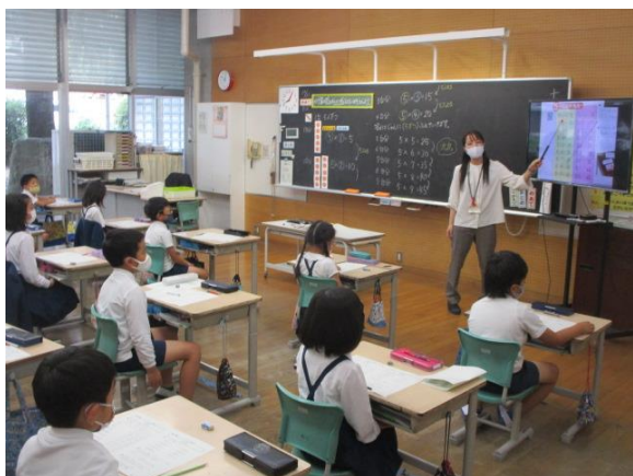
かけ算の5の段を学習している2年生