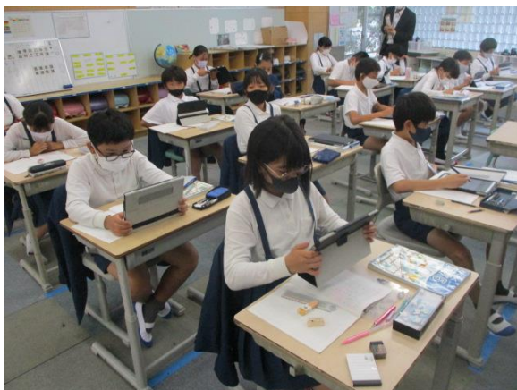
算数でタブレットを活用していた5年生