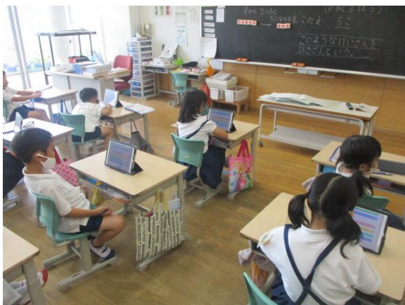
タブレットでアンケートに回答していた1年生