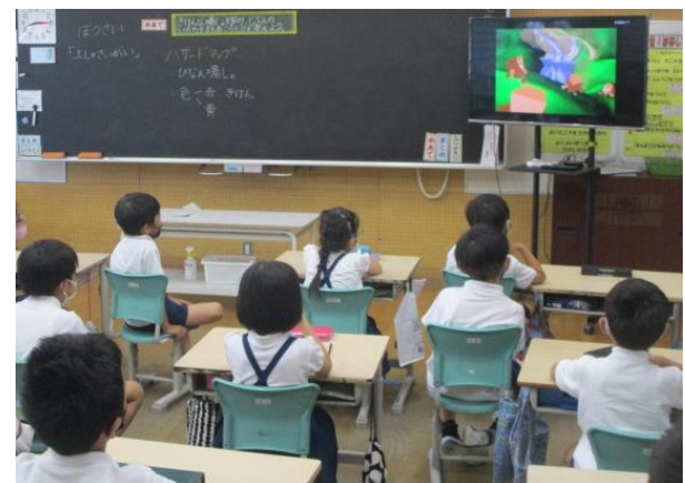
映像から自分の命を守る行動を考える2年生