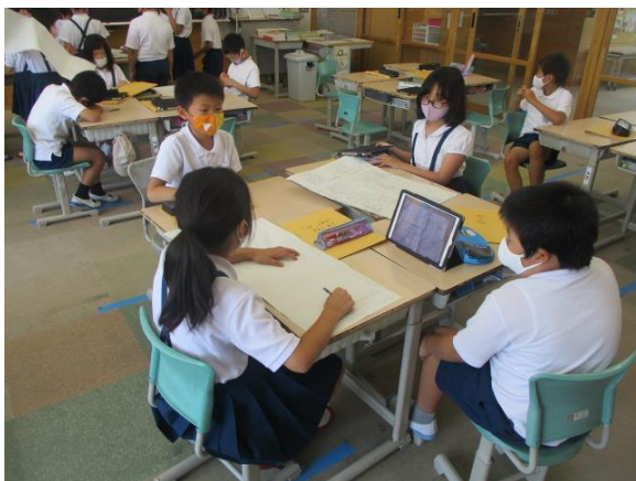
総合のまとめをグループで考える3年生