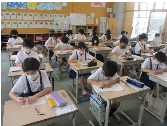
初任者による4年2組の国語の授業