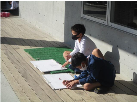
ソテツや体育館を描く