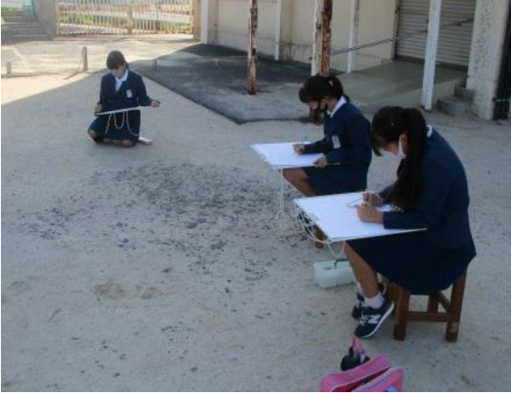
グラウンドから掲揚台を描く