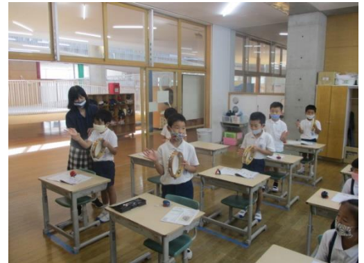
音楽でタンバリンを叩いていた2年生