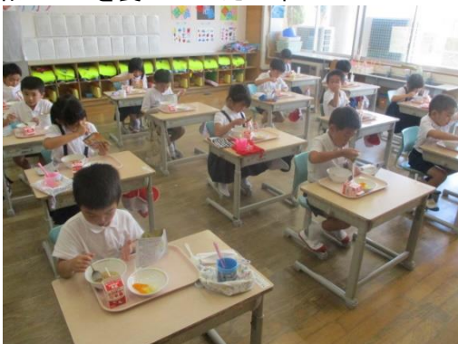
救給カレーを食べていた1年生