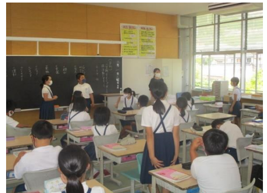
4年生も係活動について話し合っていました