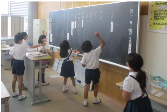
2学期の係活動を決めていた3年生