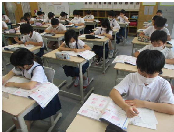
体積の公式の学習を行う5年1組