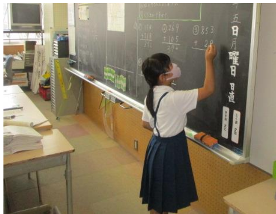
練習問題を黒板に書いていました