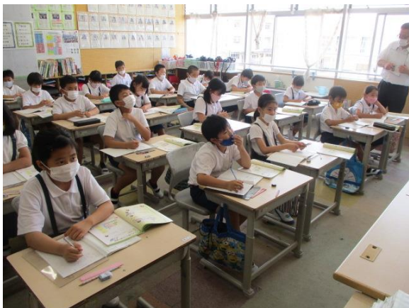
3けたの筆算の学習を行う3年1組