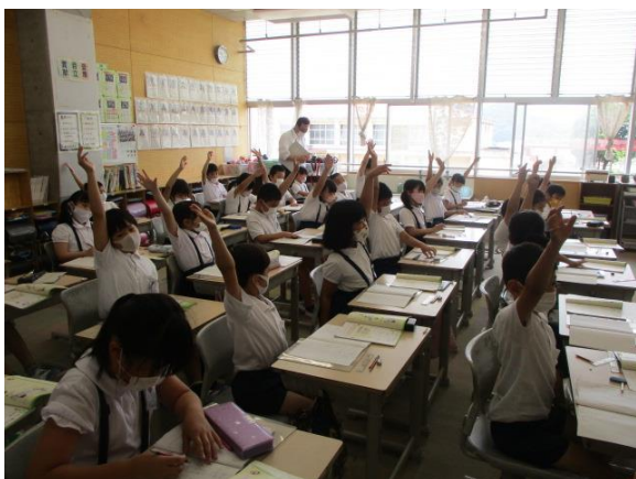
意欲的に発表していました