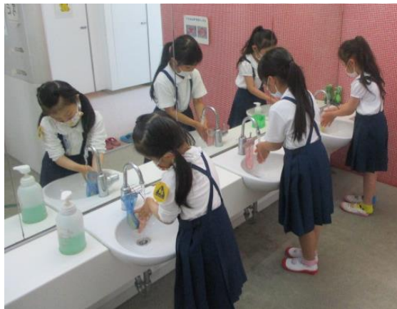
上手に手洗いを行う1年生