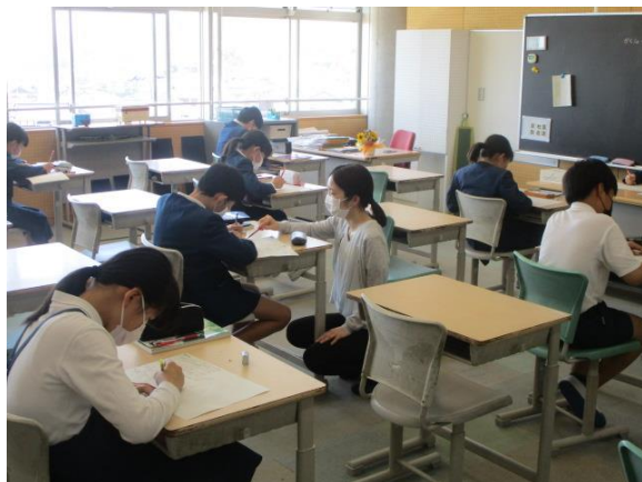
落ち着いて学習する6年生