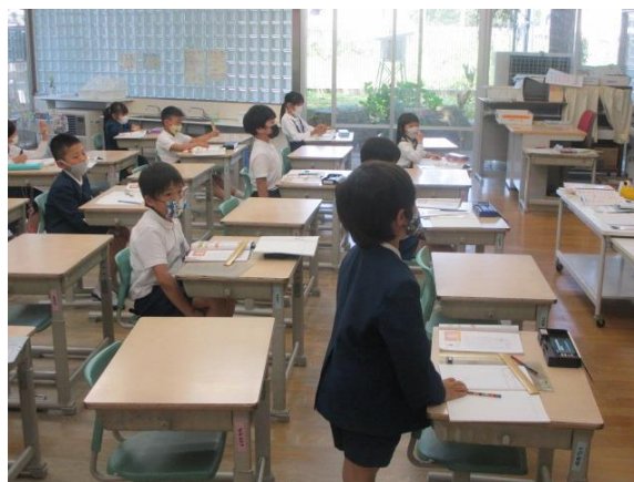
しっかり発表する2年生