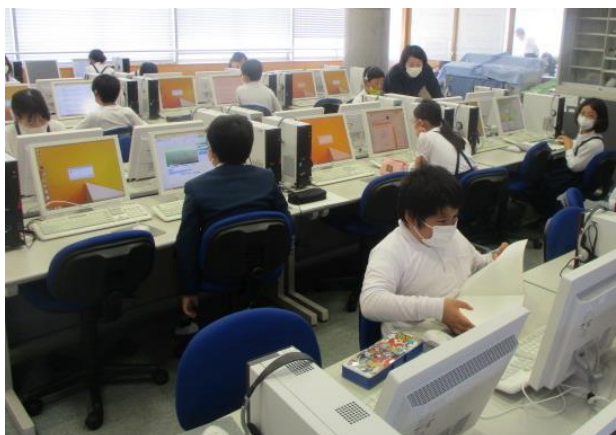
パソコンで学習を行う5年生