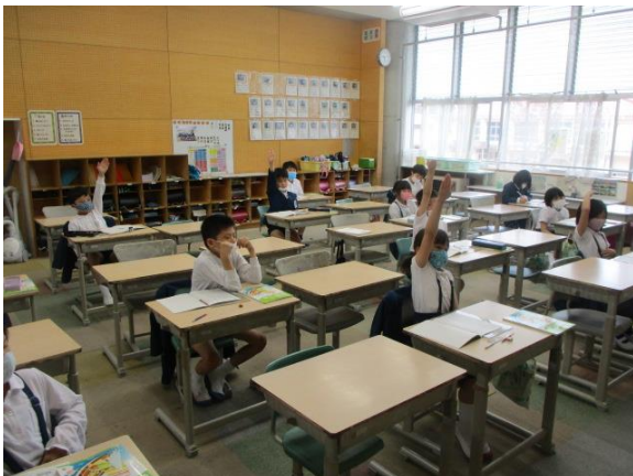
元気よく発表する3年生