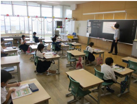
算数の学習を行う1年生