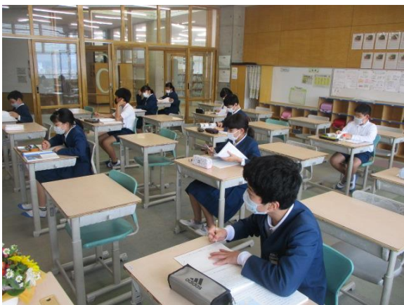
国語の学習を行う6年生