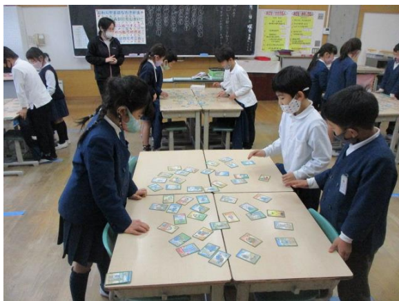
楽しくカルタを行っていた2年生