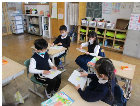
算数で形の学習をしていた1年生