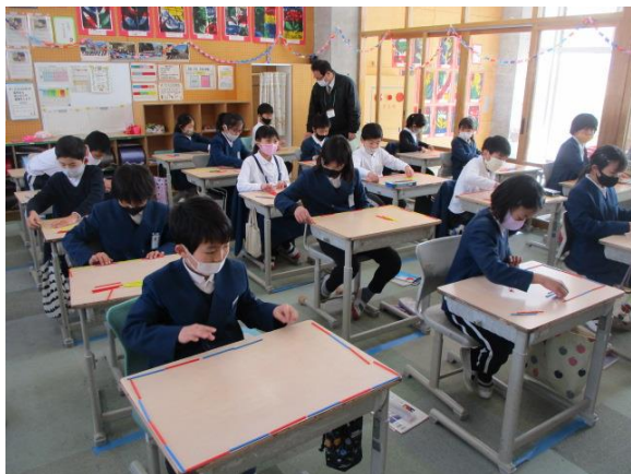
変わり方の学習で個人思考を行っていた3年生