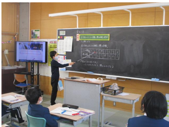
長方形の辺の長さの変わり方を説明していました