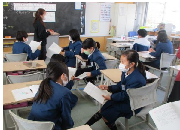
考えたことをペアで協議していた4年生