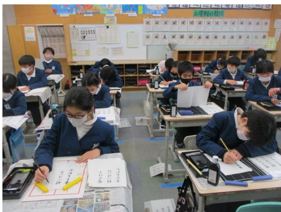
小筆で習字を行っていた5年生