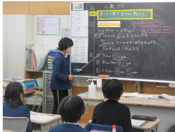
自分の考えを上手く説明していた3年生