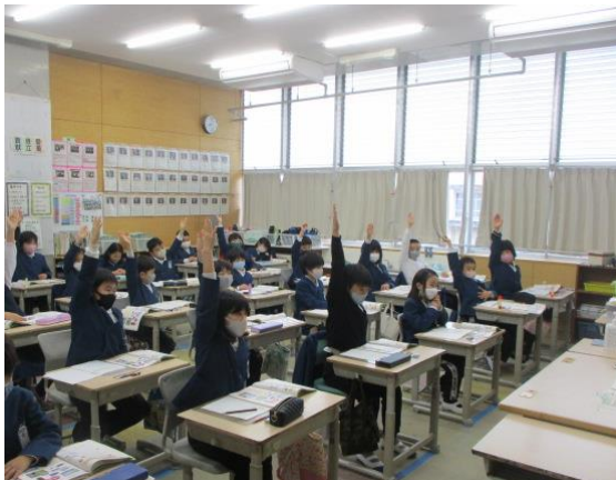
算数の少数の学習で意欲的に発表していた3年生