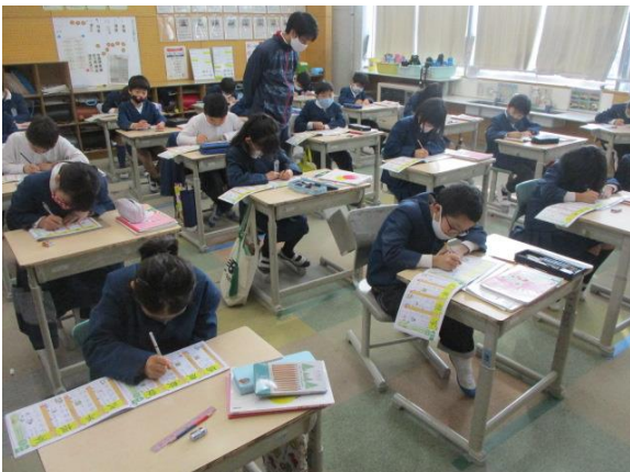
漢字練習を丁寧にしていた3年生