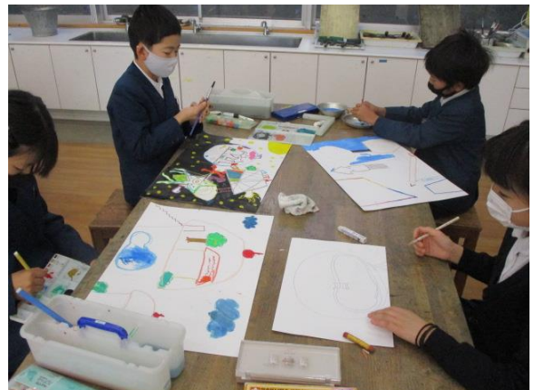
図工で、「へんてこ山の物語」を描いていた4年生