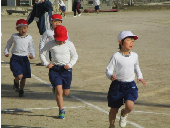
体育で、マラソンの練習を行っていた1年生