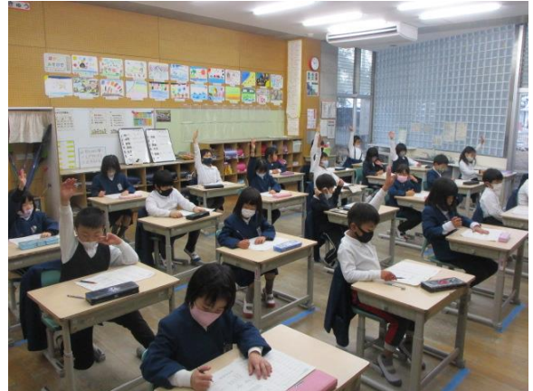
算数の問題を意欲的に行っていた2年生