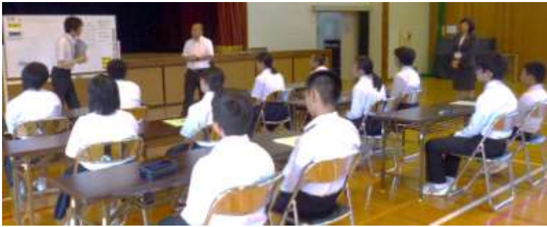
表現のための基本的なスキルを学びます