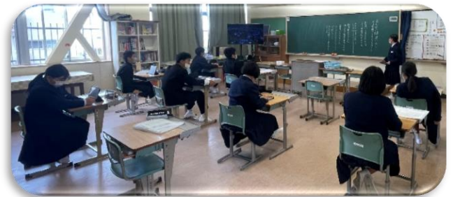
↑クラスで学級目標を決めている様子↑