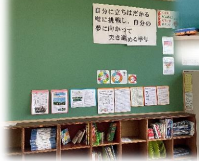
3年生教室の 後ろの掲示物