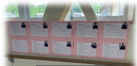
1年生の英語での 自己紹介文