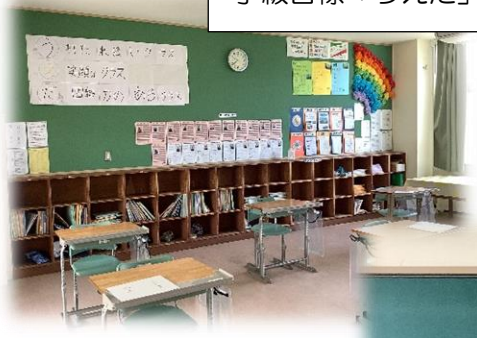
1年生の 学級目標「うえだ」