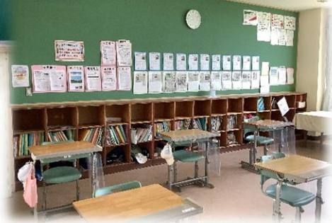
2年生教室の 後ろの掲示物