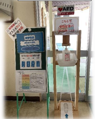
熱中症や コロナ対策について