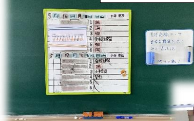
帰りの会の後、 生徒へのお知らせ