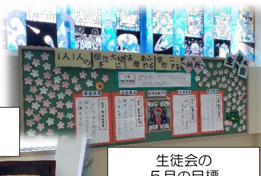
生徒会の 5月の目標