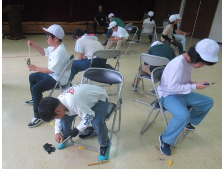
だんだん出来上がってきました