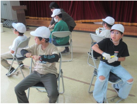
最後の活動は、竹細工です