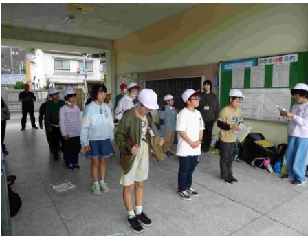
帰校式を行いました