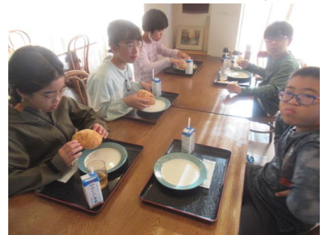
ごちそうさまでした