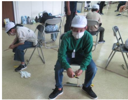
上手く飛ぶでしょうか