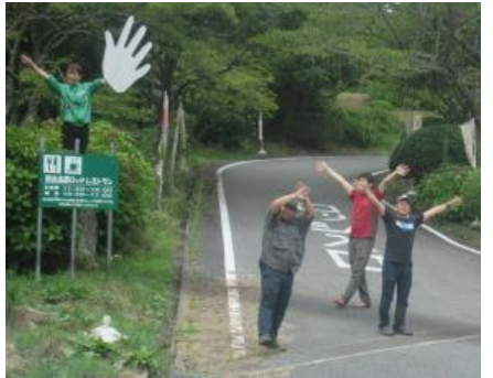
引率の先生方へお礼の言葉