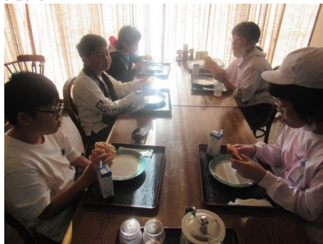
完食していました