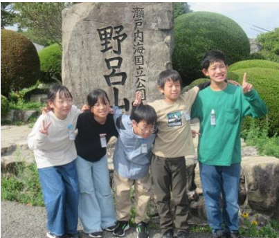
ありがとうございました