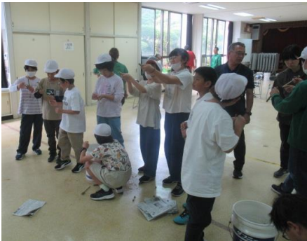
上手く飛ぶでしょうか