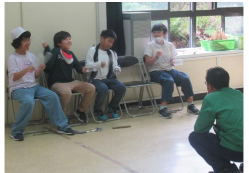
応援で盛り上げよう