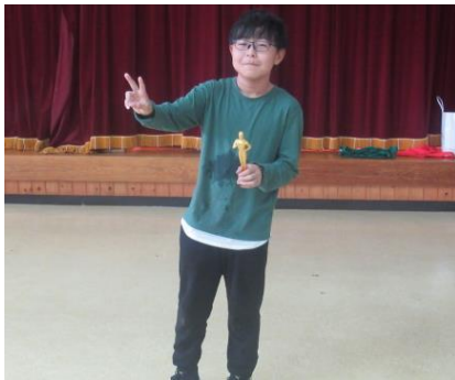
個人優勝しました