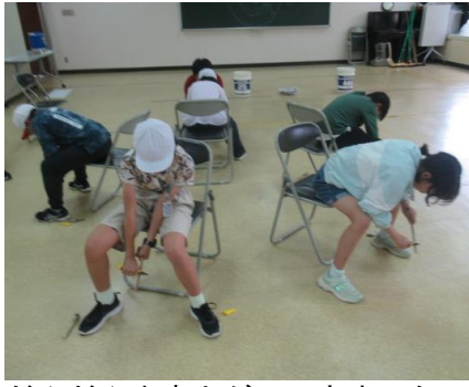
竹が硬くて、なかなか削れません