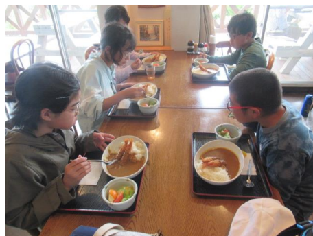
食事は全て美味しかったです