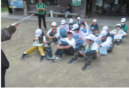
クイズを見付けました