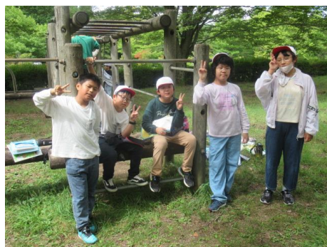
最後の昼食は、エビフライカレー