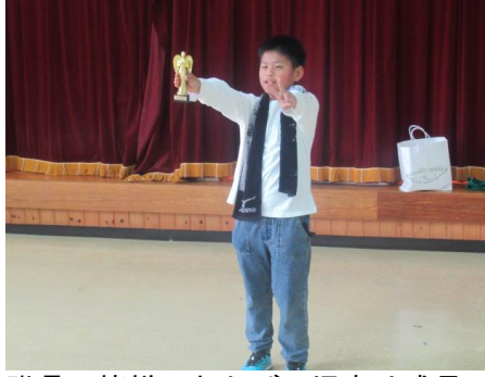
職員の皆様のおかげで児童は成長