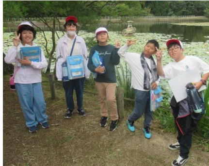
氷池で、イエーイ 2班です