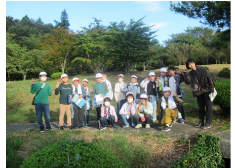
気持ち良かったです