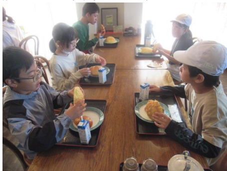
焼き立ては美味しいです