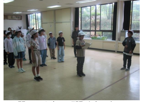
2日間、みんなで頑張りました！！