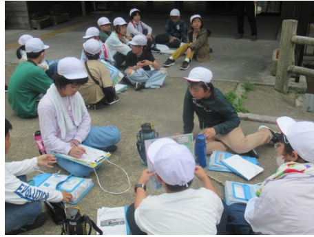
クイズの答え合わせ