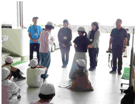
引率の先生方へお礼の言葉