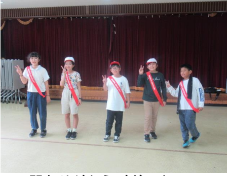
2日間ありがとうございました