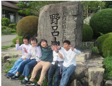
さようなら また来てね～