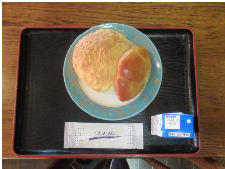
焼き立ては美味しいです