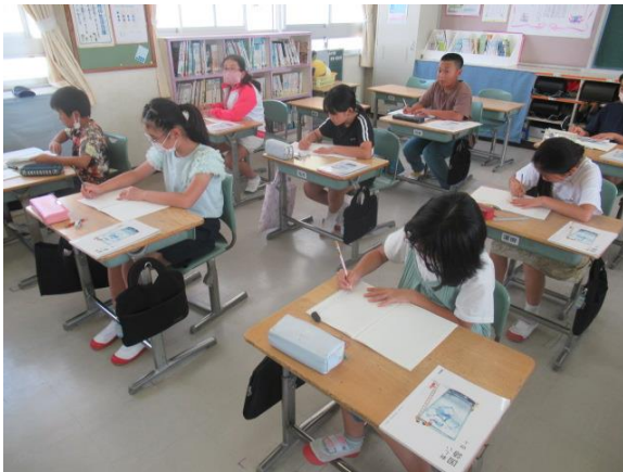
国語で、ノートに丁寧に文字を書く 4年生