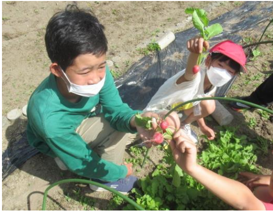
二十日大根を収穫したひまわり 2組