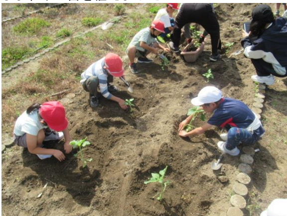
ひまわりの苗を植えました