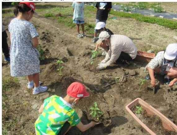
植え方を優しく教えてくれました