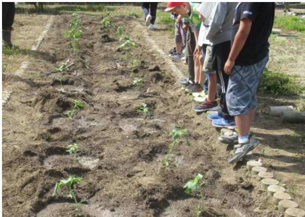
夏に大輪のひまわりが咲くことが楽しみです