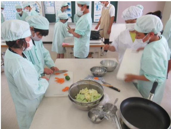
調理実習で野菜を切っていた 6年生