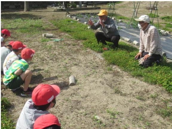
ひまわりに込められた願いを聞きました