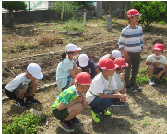
ひまわりについて知っていることを発表しました