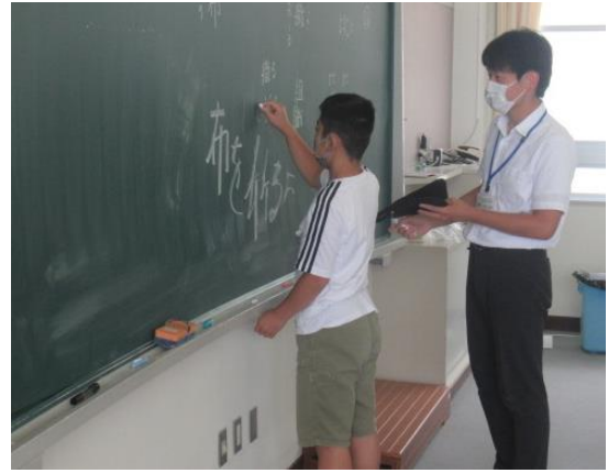
漢字の練習をしていたひまわり 1組