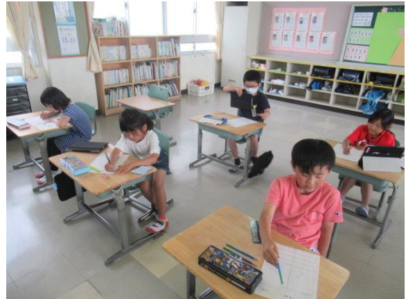
夏野菜の成長を記録する 2年生