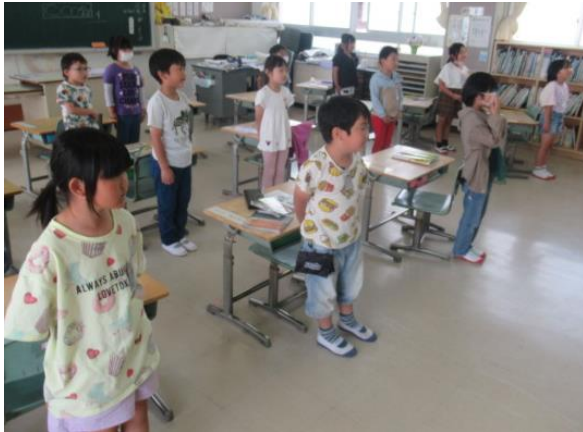
校歌の練習をしていた 1年生