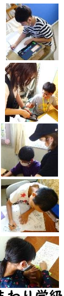
【ひまわり学級：算数科】