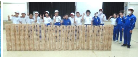
【カプラ：ナイアガラの滝】