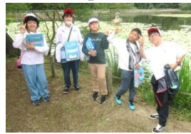
【オリエンテーリング】