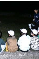
【キャンプファイヤー】