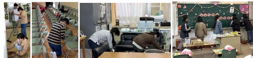
【前日の作業で、会場づくり 一人一人が自分の役割を自覚して動きました。】