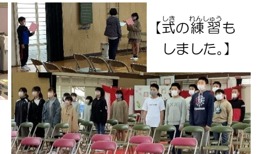
【式の練習もしました。】