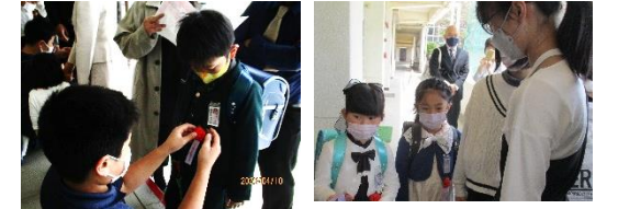
【名札と胸花をつけ、いっしょに教室へ】