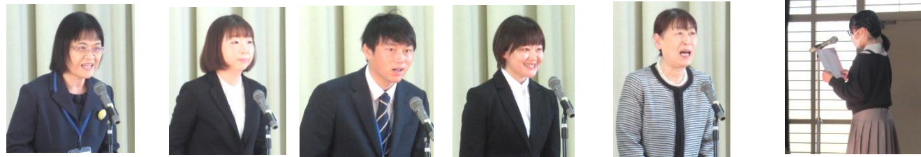
【児童代表お迎えの言葉】