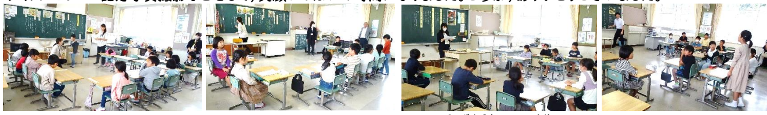
【1年生「ぼくのごと」】 【2年生「じぶんが しんごうきに」】 【3年生「小坪神楽をもう一度」】 【4年生「わたしたちの里山探検」】 【5年生「『ありがとう上手』に」】 【6年生「あなたはどうか考える?」】

道徳科の授業は、おうちのひとや地域の方にゲストティーチャーとして参加をしていただきました。また、ふれあいタイムは、PTA執行部のみなさんを中心に企画・準備をしていただき、学年ごとに「くじさがし」をして景品をいただいた後、ハンカチ落とし・クイズ・ビンゴ・記念写真撮影などをして、笑顔いっぱいの時間になりました。ご参加、ありがとうございます。