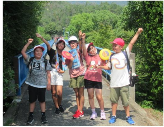
4班です ファイトー！