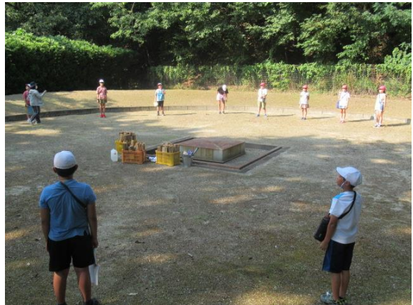
ディスクゴルフが終わり、キャンプファイヤー準備