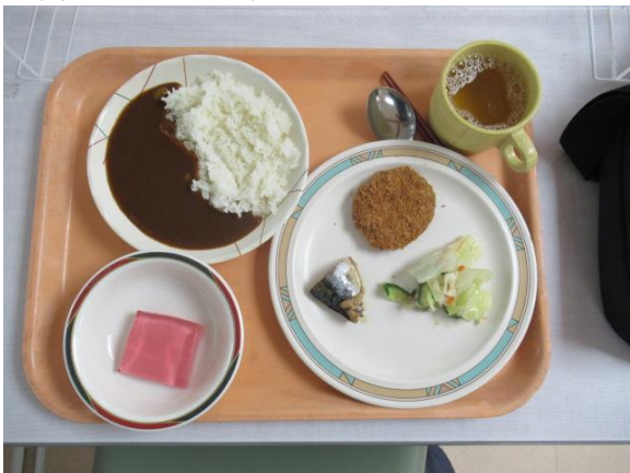
夕食のメニューです