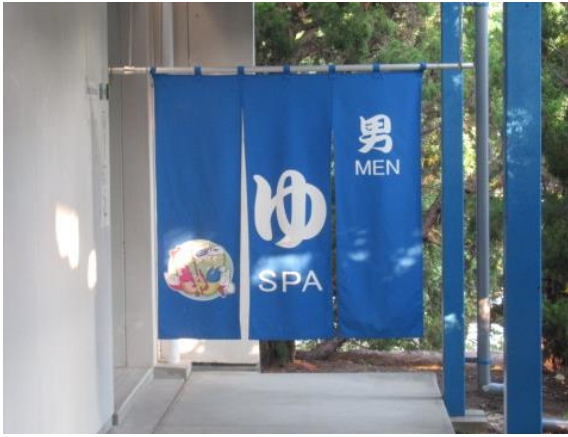
夕食の後は、入浴です