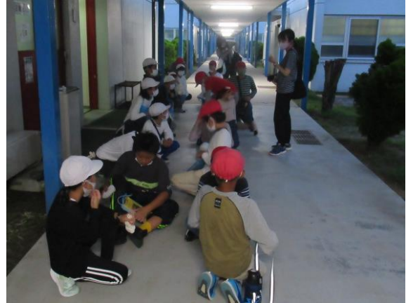
入浴が終わり、いよいよキャンプファイヤーです