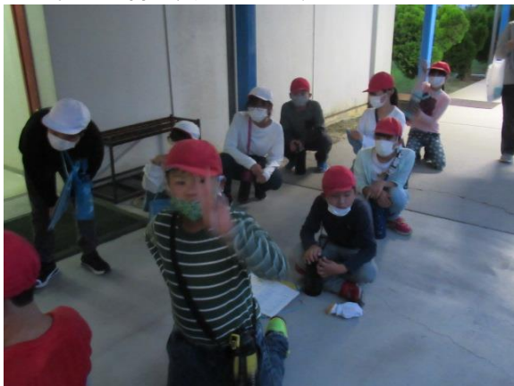
お風呂は気持ち良かったです