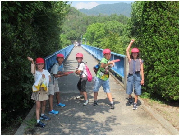
1班です 頑張るぞー！