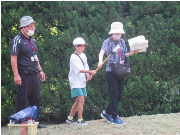
入場の仕方の確認