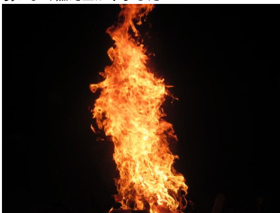
勢いよく燃え上がりました