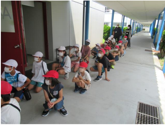
荷物を部屋に置いて、昼食会場に行きます