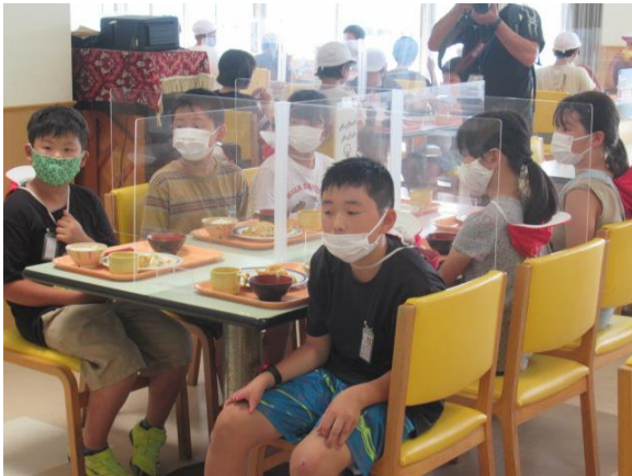
おかわりしてもいいですよ