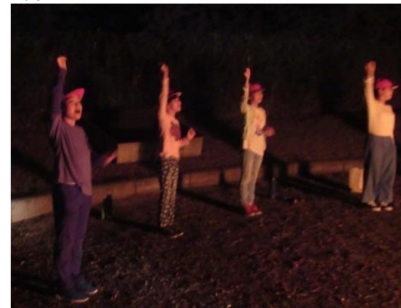
広南コール セーの！