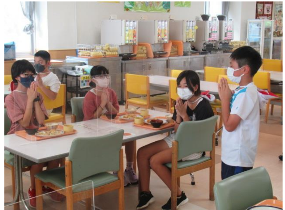
美味しくいただきます！