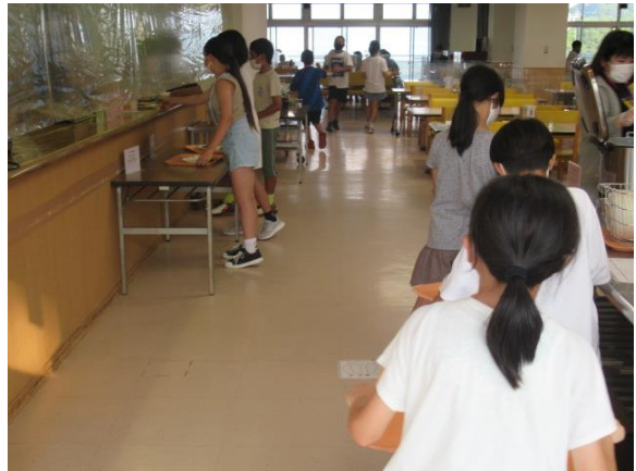
キャンプファイヤーの前に夕食です