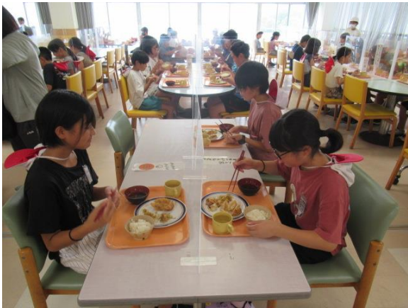
昼食は餃子を食いました