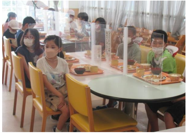
食べ残しのないようにしましょう