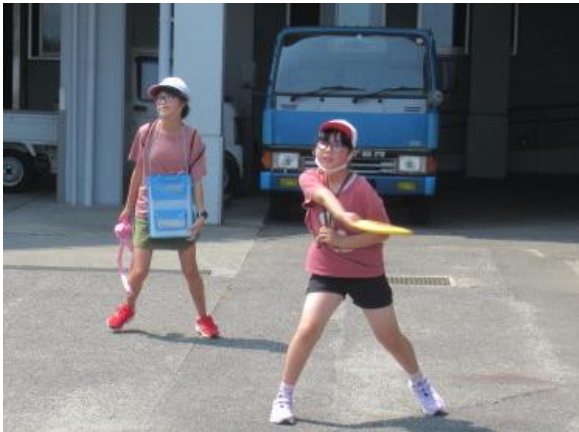
投げ方は、いいですねー