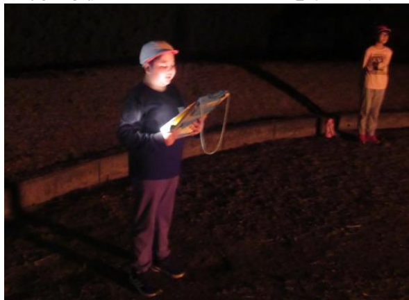
広南小学校のキャンプファイヤーを始めます