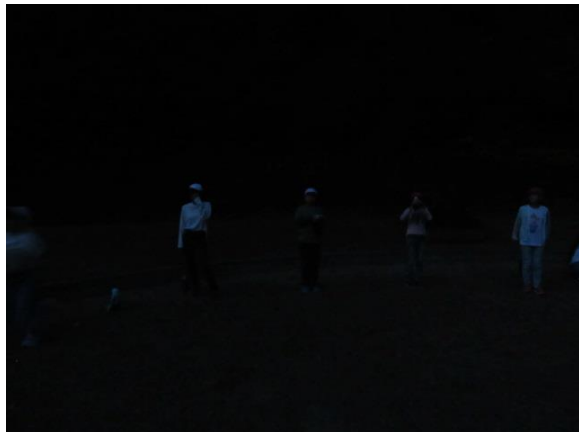
日が暮れ、真っ暗になってきました