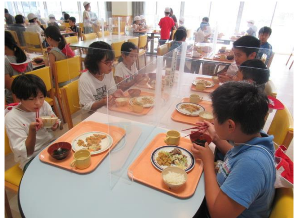
美味しかったです