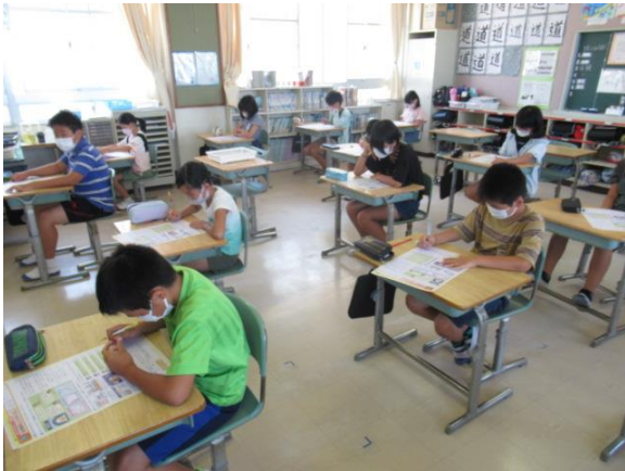
社会科のテストを行っていた5年生