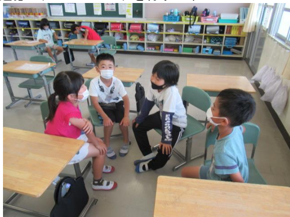
道徳でグループトークを行う2年生