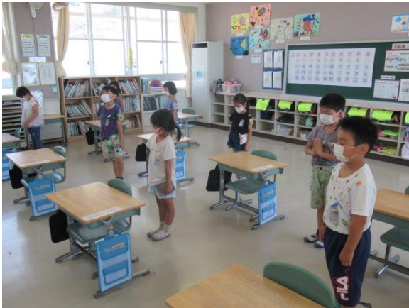
呉空襲の日で、12時に黙とうを行いました