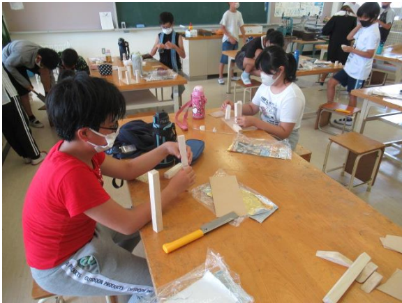
図工で木工作品を作る6年生