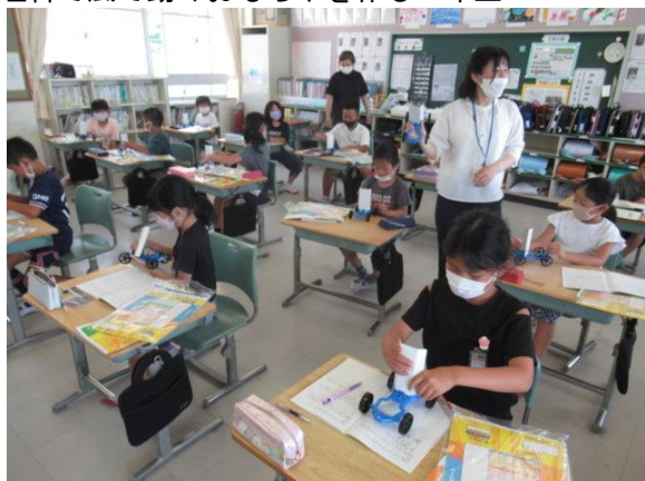
理科で風で動くおもちゃを作る3年生