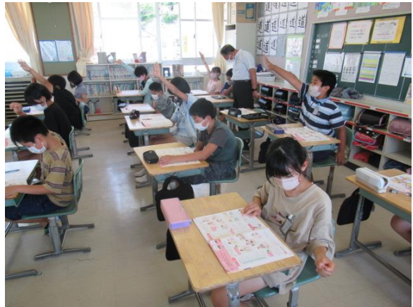
保健体育の学習で、意欲的に発表していました