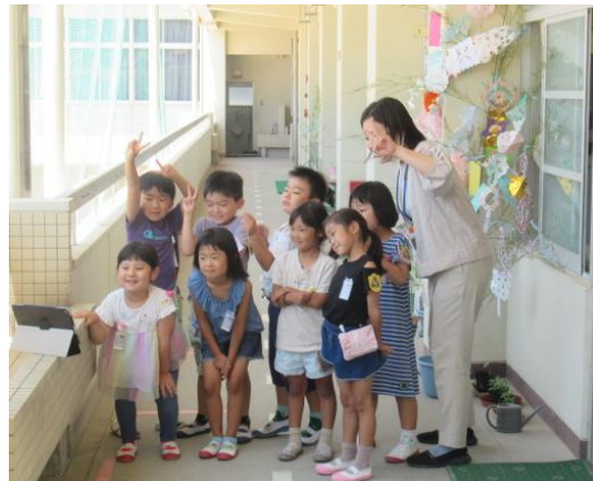
七夕飾りを作り記念撮影