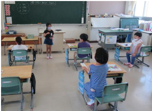
音楽で曲に合わせてカスタネットを叩く1年生