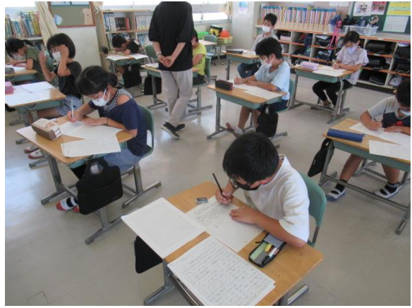
下書きを見ながら一生懸命書いていました