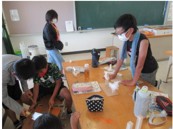
協力して板を切っていました