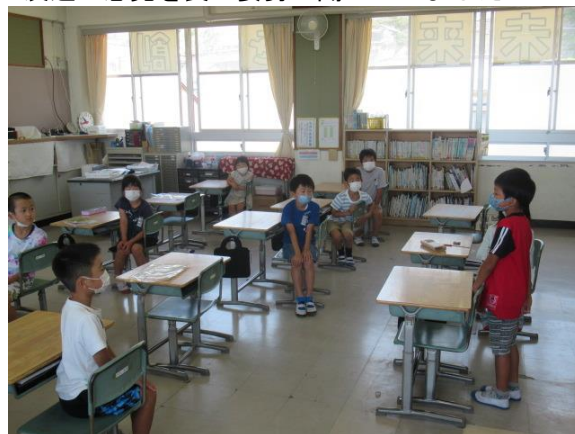
友達の意見を良い姿勢で聞いていました