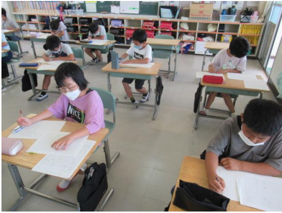
くらしの文集の作文を書く4年生