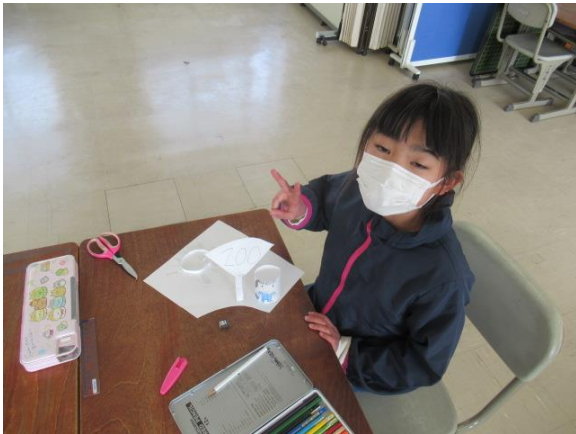
紙を使ってかわいい作品を作るひまわり2組