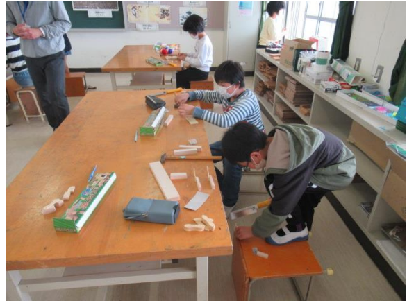
のこぎりを上手に使っていました