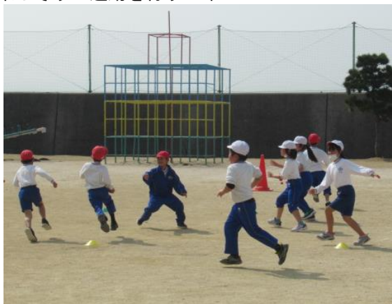
楽しそうに運動を行う2年生