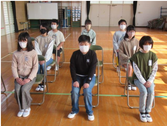
卒業式の練習をしていた5年生