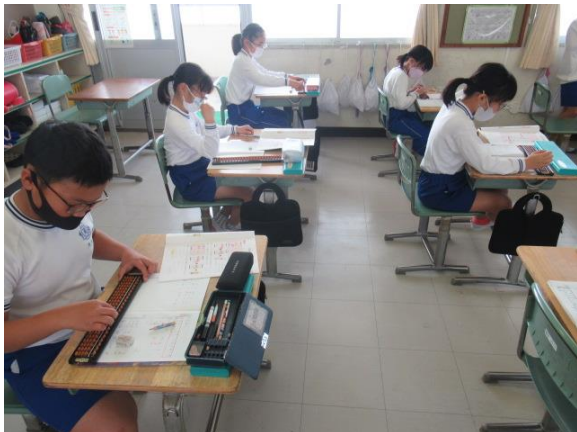
そろばんに一生懸命取り組む3年生