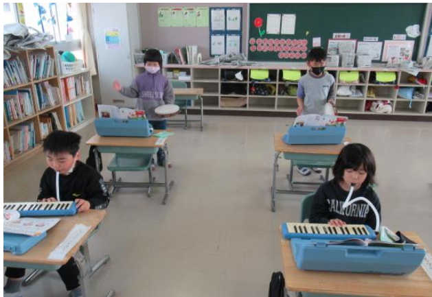
合奏を行っていた1年生