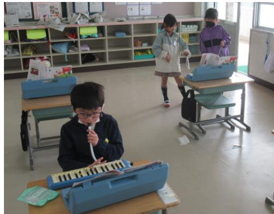
1年間の成長を感じます