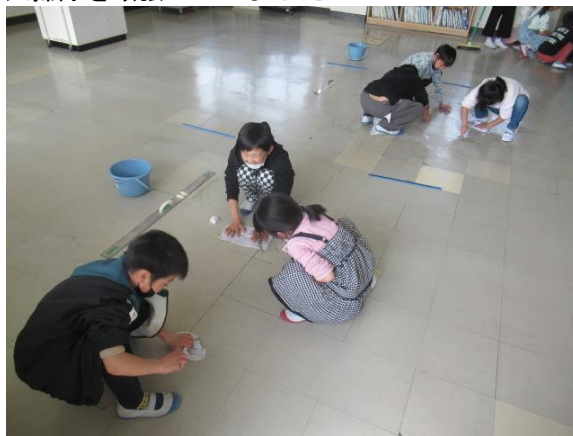
大掃除を頑張っていました