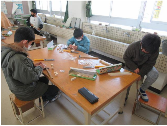
「トントンつないで」を作る4年生