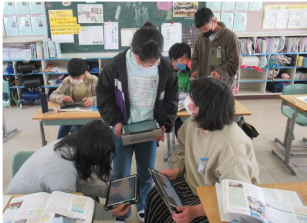
社会科で日本と外国のつながりを交流する6年生