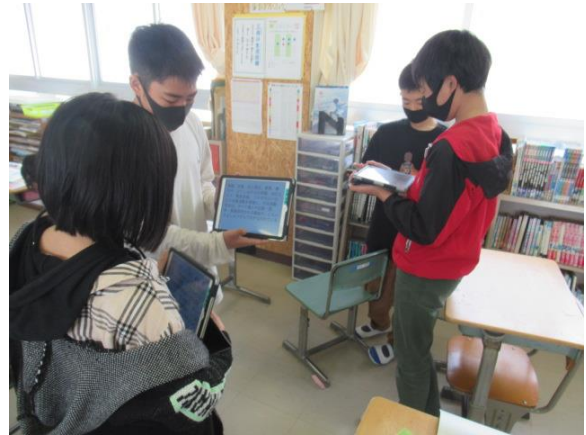
小学校生活も後6日です