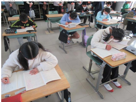
国語で、部首が同じ漢字をさがしていた3年生