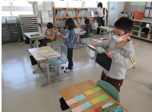
自分が作った短文を、送信していました