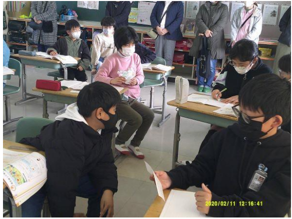
ペアで、整理した表を交流していました