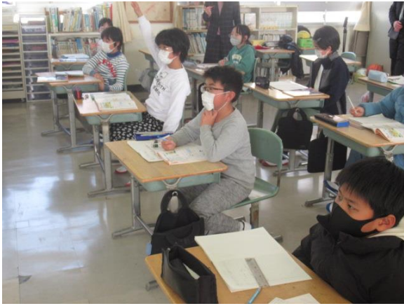
算数で、表の整理を学習していた4年生