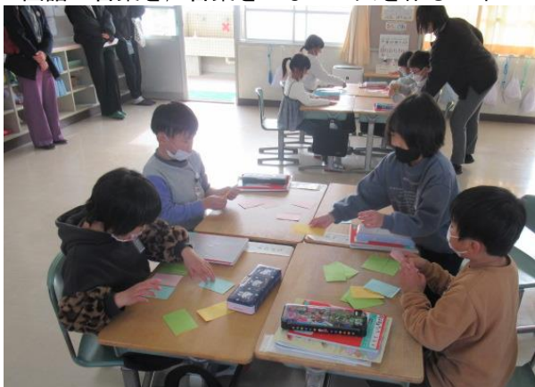
国語で言葉を、言葉をつないで文を作る1年生