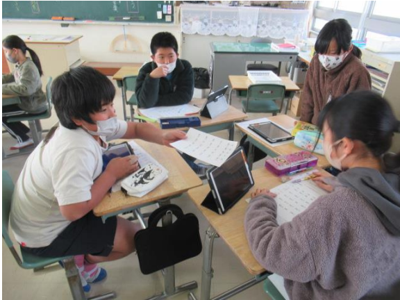
国語で、熟語の学習をしていた5年生