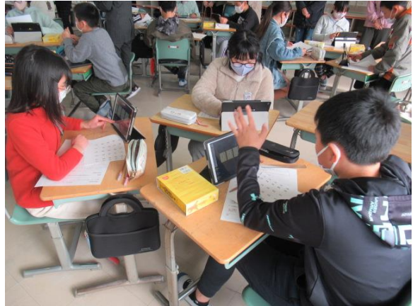
グループで、熱心に協議をしていた