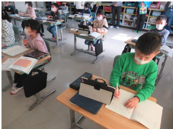
算数の、かけ算の学習をしていた2年生