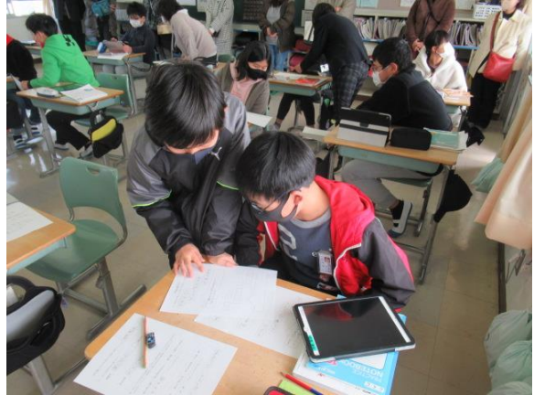
ペアで、自分が作った俳句を交流していました