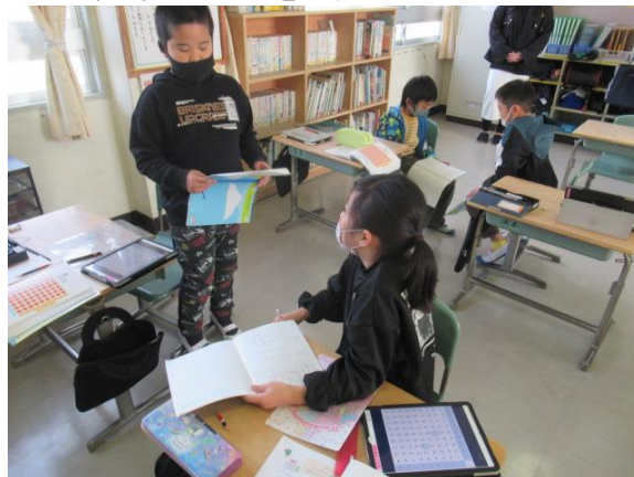
ペアで、考えたことを交流していました