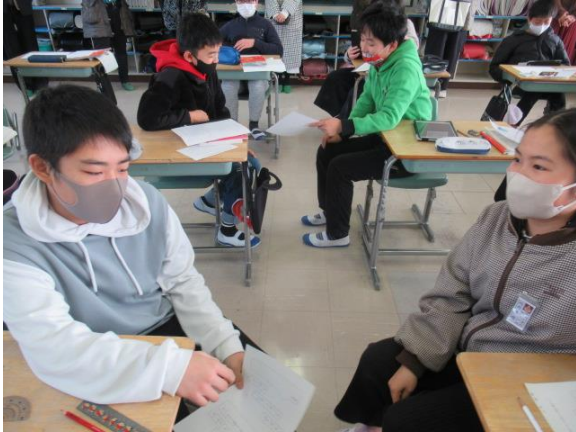
国語で、俳句の学習をしていた6年生