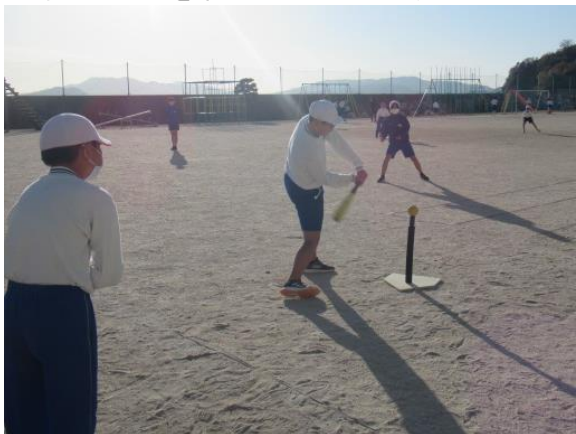
ティーボールを楽しむスポーツクラブ