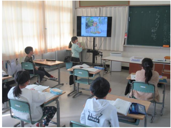
国語の登場人物の様子を発表していた2年生