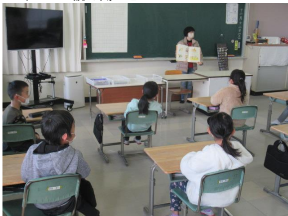
2年生での読み聞かせ