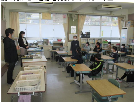
読み聞かせの感想を発表していた3年生