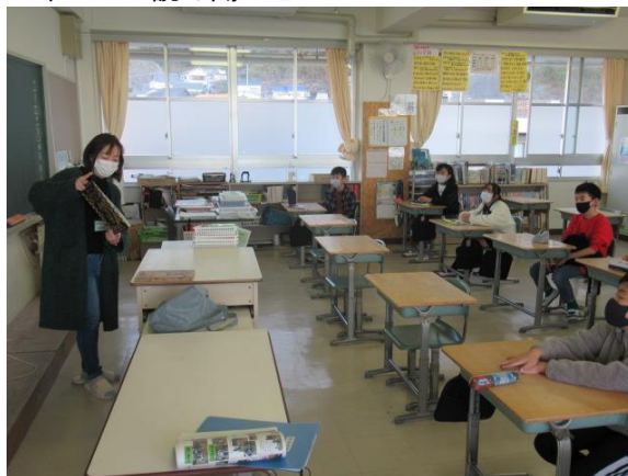
6年生での読み聞かせ