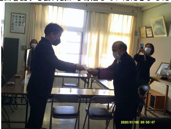
里山を愛する会代表から寄贈していただきました