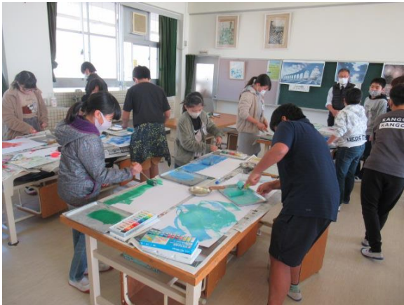
ローラーを使って作品を描く5年生