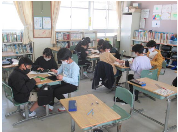
里山の会の皆さんへの感謝会の準備を行う4年生