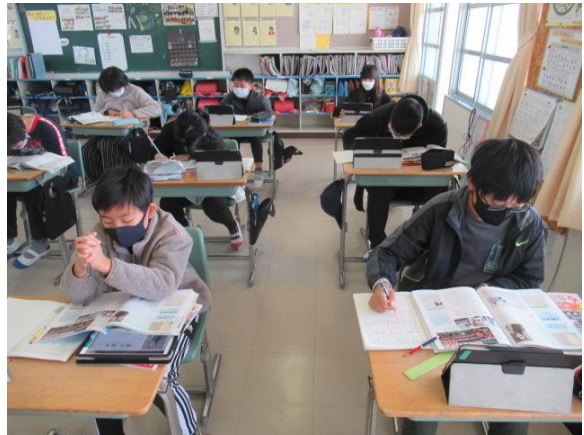
社会科で、調べ学習を行う6年生