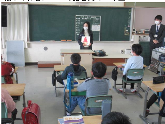
絵本の作者について話を聞く4年生