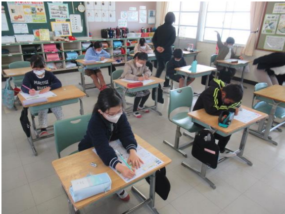
算数のテストを行っていた3年生