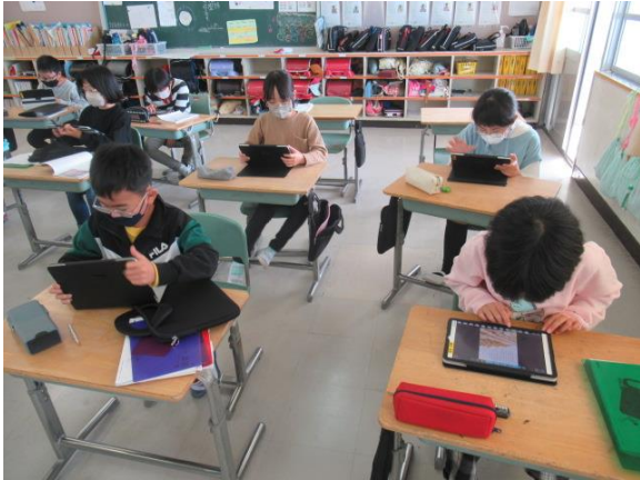
国語で、「ごんぎつね」の学習を行う4年生