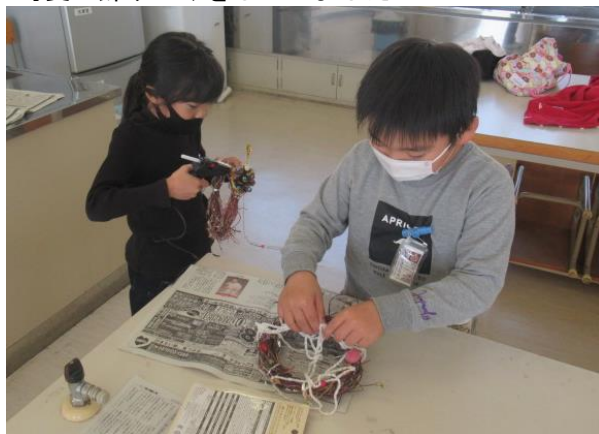
可愛い飾りつけをしていました