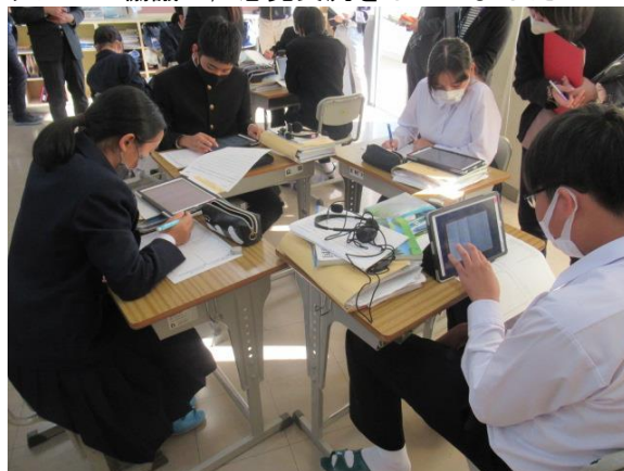
グループ協議で、意見交流をしていました