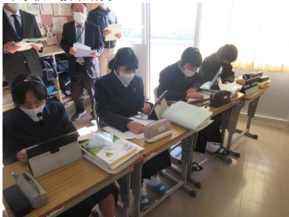
中学校の授業研究