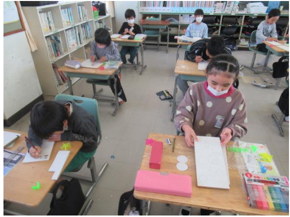
ビー玉の通り道を考えていました