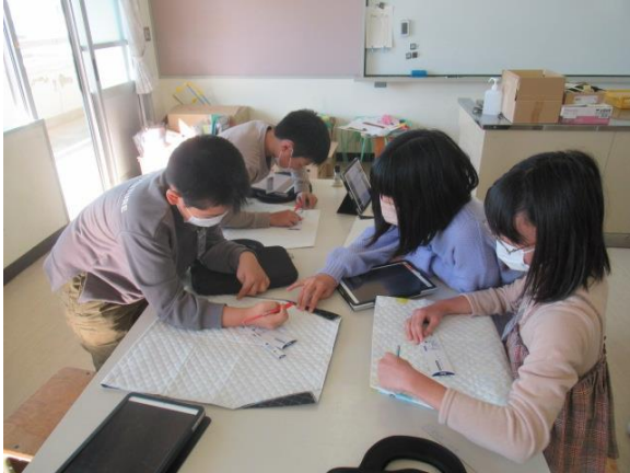
家庭科で、ナップサック作りを行う5年生