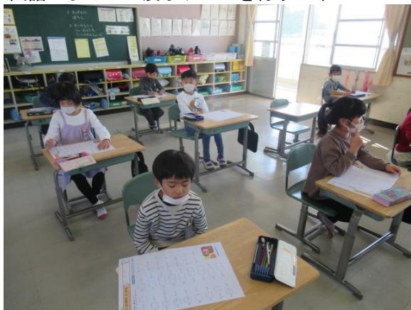
国語のまとめの漢字テストを行う2年生