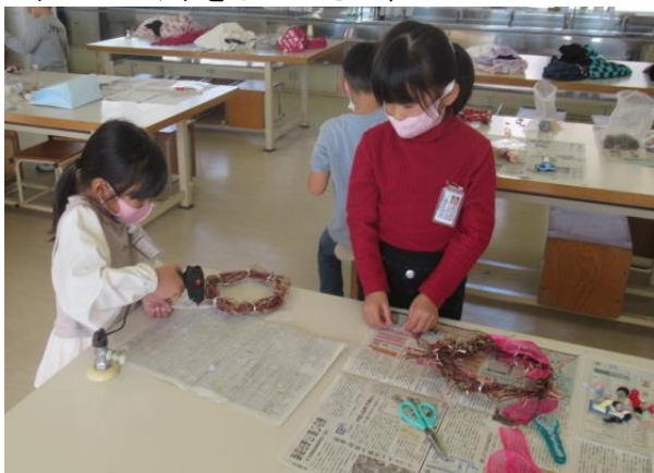
リースづくりをしていた1年生