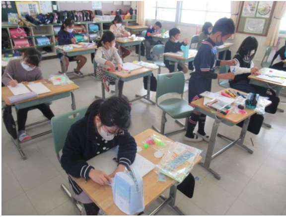
図工でコリントゲームを作る3年生