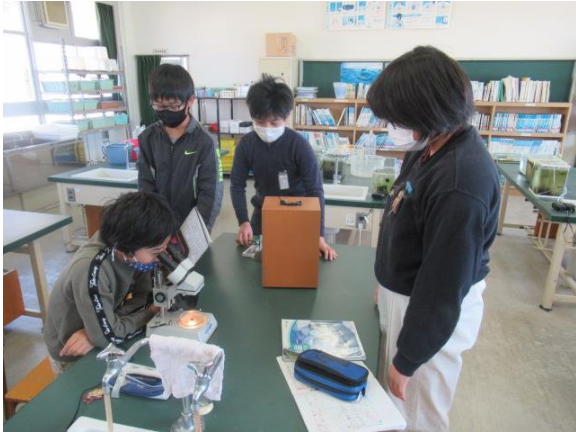
理科で、火山灰を顕微鏡で見ていた6年生