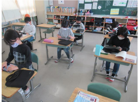
分からない言葉の意味を調べていました