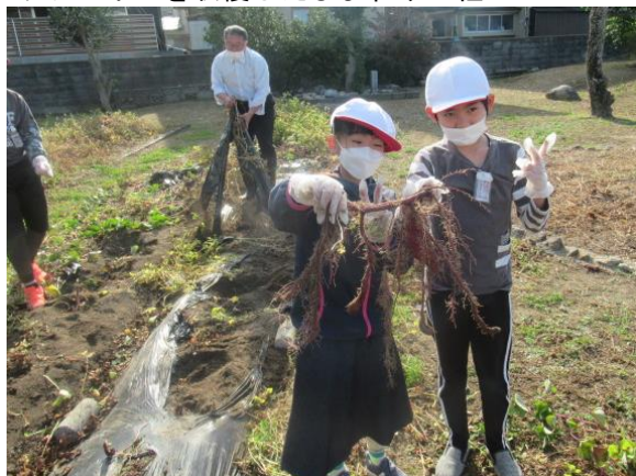
サツマイモを収穫したひまわり2組