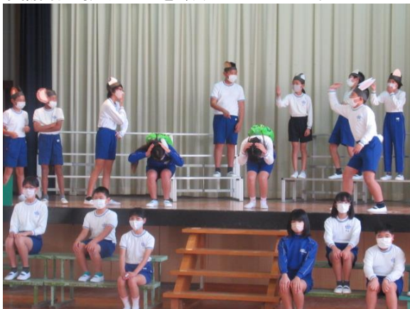
英語劇の振り付けを頑張っていた5年生