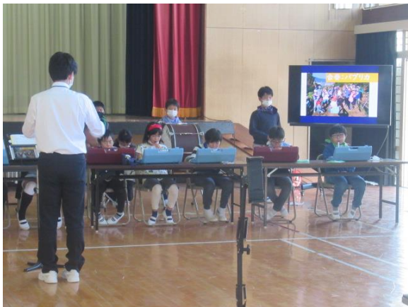
「パプリカ」の合奏の練習を行う4年生