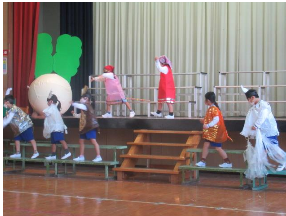
大きなかぶも登場していました