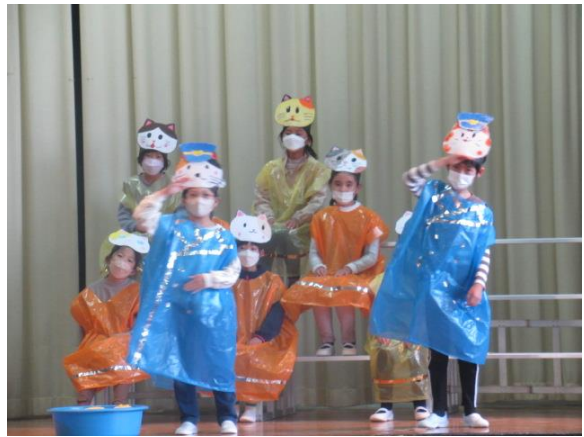
動作も上手になってきました