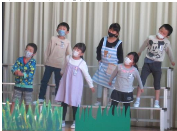
楽しそうに劇の歌を歌う2年生