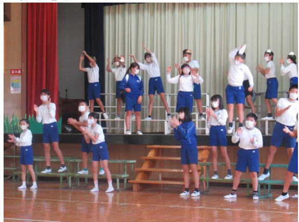
一体感を感じます