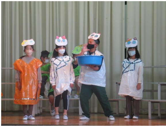
3年生も衣装を着て劇の練習をしていました