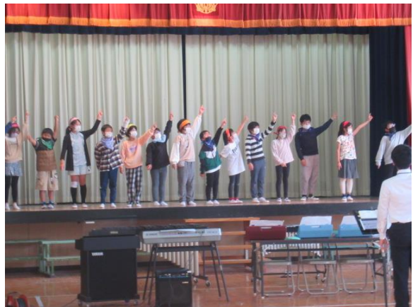
合唱は「ありがとうソング」を歌います