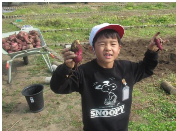
2年生も収穫していました