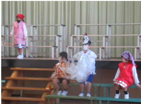
衣装を着て劇の練習を行う1年生