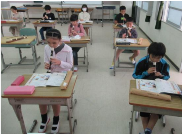
リコーダーの練習を行う3年生