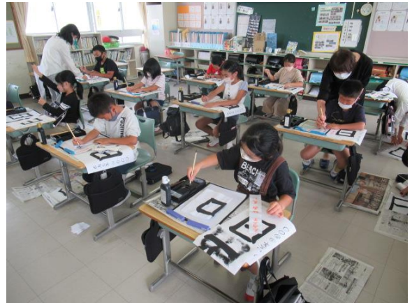
習字で、名前の書き方を練習していました