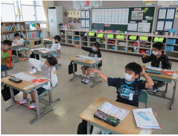
漢字の筆順を練習する1年生