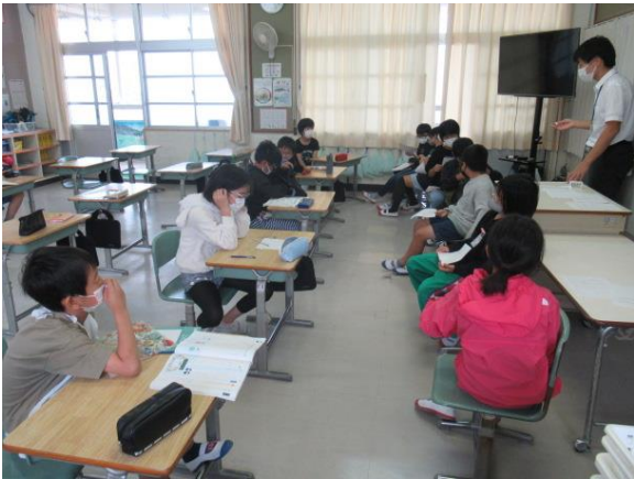
理科で、空気でっぼうの実験を行う4年生