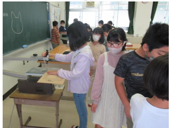
図工で、電気系のこぎりを使って作品を作る5年生