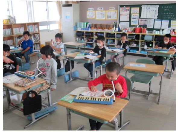
鍵盤ハーモニカの練習を行う2年生