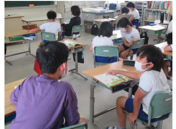
道徳でペアトークを行っていました