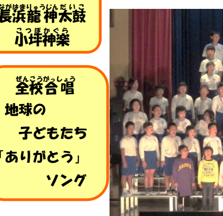
全校合唱 地球の 子どもたち 「ありがとう」 ソング

11月16日(土)の学習発表会には、多数ご来場いただきましてありがとうございました。短い時間の中で、どの学年も精一杯取り組むことができ、テーマどおり、令和元年の新しい一歩を歩み出したのではないかと思います。この頑張りを、今後の学校生活にも活かし、何事にも挑戦する子どもたちに育ててほしいと願っています。