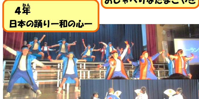
4年 日本の踊り一和の心一