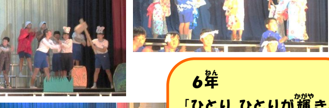
6年 「ひとりひとりが輝き、 大きな輝きへ」 コンドルは飛んで行く 時の崖 カルメン前奏曲