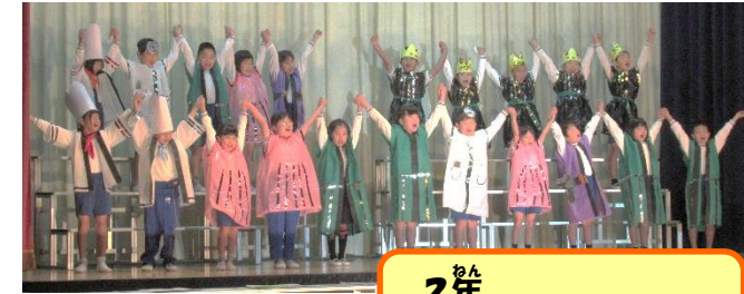
2年 おしゃべりなたまごやき

11月16日(土)の学習発表会には、多数ご来場いただきましてありがとうございました。短い時間の中で、どの学年も精一杯取り組むことができ、テーマどおり、令和元年の新しい一歩を歩み出したのではないかと思います。この頑張りを、今後の学校生活にも活かし、何事にも挑戦する子どもたちに育ててほしいと願っています。