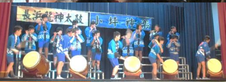
5・6年 長浜龍神太鼓 小坪神楽