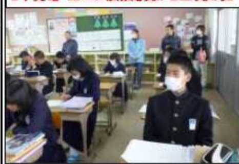
1年英語「熱心に授業を受ける生徒たち」

1月17日(水)、第3学年では私立高の入試が始まった日に、第1・2学年の保護者を対象とした授業参観・学年懇談会(2年は修学旅行説明会)を開催し、平日にもかかわらず、多くの保護者の皆様にご来校いただき、授業での生き生きとした生徒の様子をご覧いただきました。その後、第1学年では、教員から生徒の近況報告と携帯やパソコンの利便性と危険性の説明を行