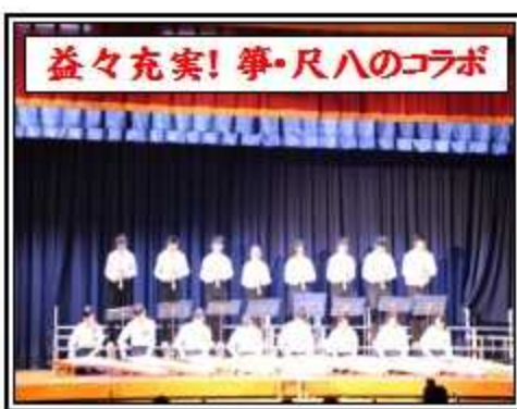
益々充実! 華・尺八のコラボ

10月14日(土)の9時より、平成29年度文化活動発表会が開催され、「第5回広南劇場」というネーミングのもと、「いつもお世話になってる保護者や地域の方に感謝の気持ちを伝える」べく、生徒たちが授業での学びの成果を一杯ステージや展示で発表しました。