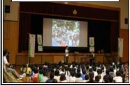
プロジェクトを通じたアフリカの子供たちとの交流に感銘!

9月22日(金)に、シドニー五輪マラソン女子金メダリストの高橋尚子さんが広南学園を訪問され、児童生徒、保護者・地域の方約280名の前で講演をして下さいました。これは、高橋さんが中心となって、家庭で不要となった運動靴を集め、