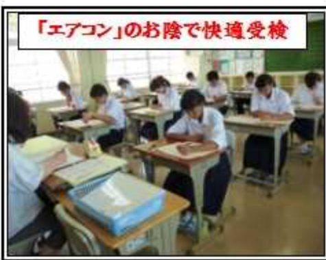
「エアコン」のお陰で快適受検

今年、念願のエアコンが各クラスに設置され、快適な環境で授業が行えることを本当に嬉しく思います。呉市及び呉市教育委員会に心より感謝いたします。