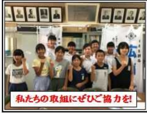
私たちの取組にぜひご協力を！

広南児童・生徒会を中心に、サイズがあわなくなつた靴をフリカの子どもたちへ届ける取組です。詳しくはこちらしを参照してください！