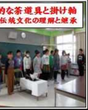
本格的な茶道具と掛け軸 日本伝統文化の理解と継承

2月23日(金)に、5年9年交流「お茶会」が開催されました。これは、5年生が地域の先生から学んだことを活用して、卒業する9年生に感謝の気持ちを伝えるプロジェクトです。 「忙中閑あり」、美味しい和菓子と味わい深い抹茶のもてなしに9年生もほっと一息、卒業を前にまた一つ大切な思い出ができました。