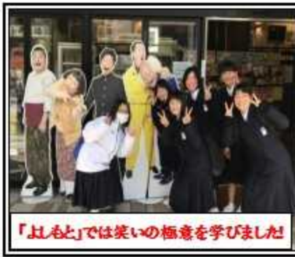
「はもと」では笑いの極意を学びました

★「社会生活のナー・安全・健康管理等」に対する情報収集・判断力及び思考力・表現力を高める」 ★ホテルでユニットバスの外側がぬれたらしっかりと拭いたり、ベッドを最初と変わらなくくまなくきれいに整えて、清掃の方に「掃除がとてもしやすかった」とほめてもらってうれしかった。 ★USJに向かう電車の中で気分が悪くなったという人に声をかけ、手助けをしている人を見てすごいと思った。 ★USJの人たちは神対応で