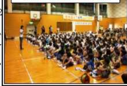
多くの地域の方も駆けつけ熱気むんむんの体育館

シドニー五輪金メダリストQちゃん の学校訪問に生徒も地域も大興奮! 「アフリカの子どもたちに笑顔を!」 講演内容に全員が感銘