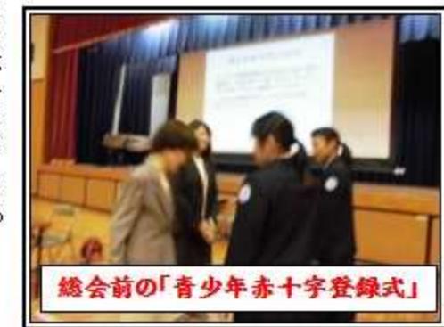
総会前の「青少年赤十字登録式」

生徒総会前、日本赤十字社による、青少年赤十字登録式が行われました。講師の方のお話、バッチの受領を受けて、より一層社会貢献