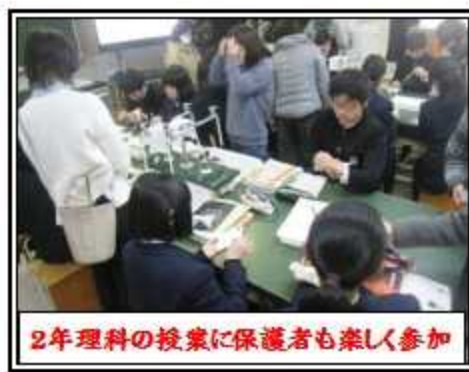
2年理科の授業に保護者も楽しく参加