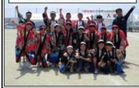
先輩の伝統を受け継ぐ2年生!