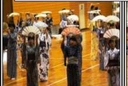
全員が艶やかな着物姿! 日本の伝統文化の良さをまた一つ学ぶことができました!

呉市立広南中学校 〒737-0136 呉市長浜四丁目1番9号 Tel 0823-71-7920 Fax 0823-74-3502 hirn@kure-city.jp