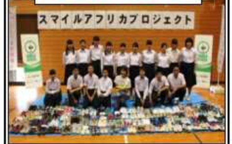
集まった運動靴を前に各学年ごとに記念写真

広島県の女子ソフトテニスでは全国でもトップレベルで、第一試合の世羅中には見事勝利しましたが、第二試合で強豪の祇園東中と対戦し惜敗しました。しかし、このようなレベルの高い大会に「団体出場」でき、学ぶことも大変多かったと思います。部員たちの健闘を讃えるとともに、今後の学校