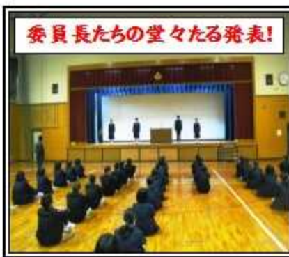
委員長たちの堂々たる発表!