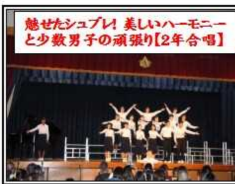
魅せたシュプレ! 美しいハーモニイと少数男子の頑張り【2年合唱】

の気持ちが前よりも強くなったことです。この企画の社長になれたことで、「起業企画プロジェクト」の目的が地域や社会貢献だということがよく分かりました。最初は、「売り上げの利益を寄付するけれど、そんなに集まるのか?」「本当に貢献できるのか?」と心配になっていたので、みんな協力して販売すると