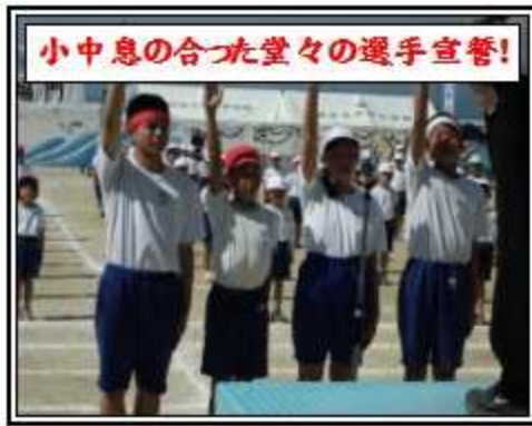
小中息の合つた堂々の選手宣誓!

5月20日(土)の9時より、「第6回広南学園運動会」を開催しました。今年一番の暑さの中、最後まで頑張り抜いた児童、衣装で地域の方の協力も得ながら、観る人に深い感動を与えた広南中ソーラン、児童生徒の力一杯の競技・演技に、熱き声援をいただいた来賓・地域・保護者の皆様にご心よりお礼申し上げます。 【赤組団長の感想】 僕は今回の運動会で団長で