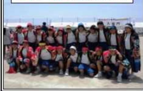
ソーランで完全燃焼. 3年生!