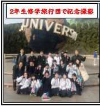
2年生修学旅行団で記念撮影

★「班別自主研修で、自ら計画し、協働して行動することで、挑戦心と責任感を養う」 ★協力してできたと思う。予想外の出来事もあったけど、旅行前に「マウズ頑張りたい」と思っていたことができてとても嬉しい。クラスメートの新たな一面を知れた。 ★タクシーのドライバーの助けで、オーストラリア、シンガポール、チェコなど様々な国の人と交流することができた。外国の人の日本に対する思いが聞けた。 ★全員で少しずつ小遣いをだしあってお礼の意味を込めたお菓子をあげたという班があってその気持ちがすごいなと思った。 ★班別自主研修で、会計係の仕事で丁寧に領収書を集めることができた。