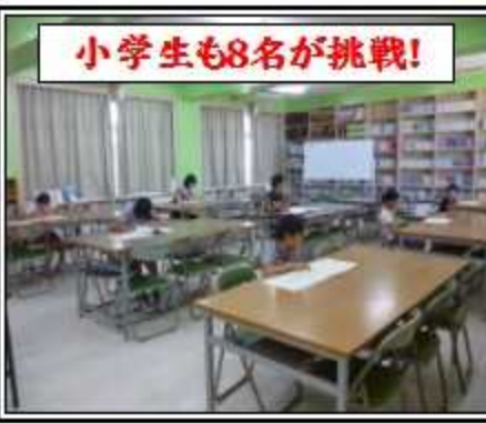
小学生も8名が挑戦!