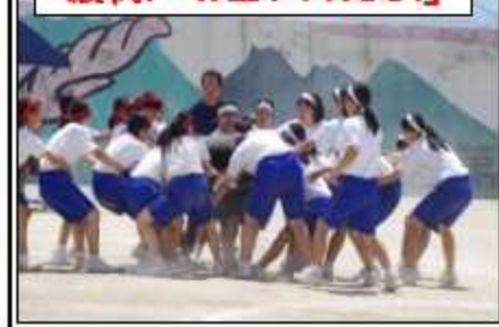
激戦! 「お宝ゲットだぜ!」