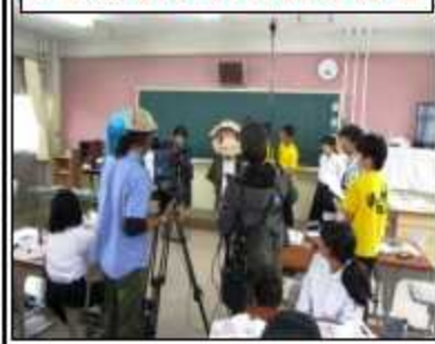
2年起業企画の取材風景

この取材の様子は、11月3日(金)18時56分からRCC「こちら!くれきん新聞!」で放映されます。ぜひご覧ください!