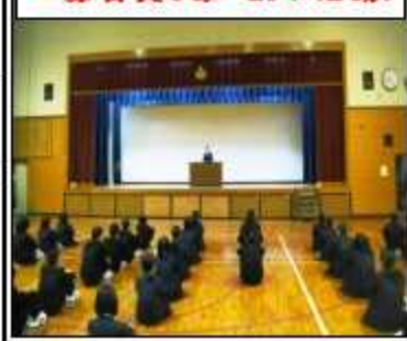
工藤会長のあいさつに感動!

いします。また、先週の金曜日に「試験計画表」が配付されました。皆さん、学習を計画的に進めていることと思います。月曜日から試験がスタートするので、全力が出し切れるように頑張りましょう。