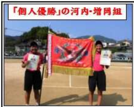
「個人優勝」の河内・増岡組