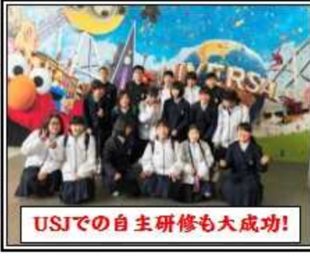
USJでの自主研修も大成功!

★「社会生活のナー・安全・健康管理等」に対する情報収集・判断力及び思考力・表現力を高める」 ★ホテルでユニットバスの外側がぬれたらしっかりと拭いたり、ベッドを最初と変わらなくくまなくきれいに整えて、清掃の方に「掃除がとてもしやすかった」とほめてもらってうれしかった。 ★USJに向かう電車の中で気分が悪くなったという人に声をかけ、手助けをしている人を見てすごいと思った。 ★USJの人たちは神対応で