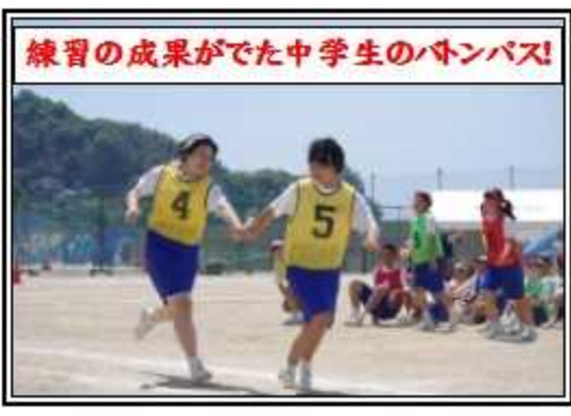
練習の成果がでた中学生のバトンパス!