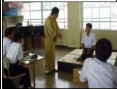
切磋琢磨して、笑いで来場者を幸福にします!

「第5回広南劇場」では、そのネーミングのもと、「保護者や地域の方に感謝・貢献の気持ち伝える」べく、生徒たちが授業での学びの成果を精一杯ステージや展示で発表致します。多数の皆様のご来場を心よりお待ちしております。