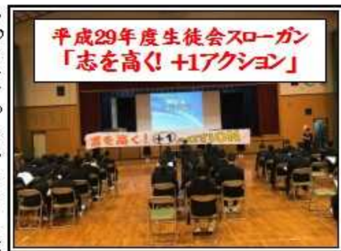
平成29年度生徒会スローガン「志を高く！+1アクション」

かったです。あいさつ+1アクションはこれからのなので、自分から率先していきたくです。