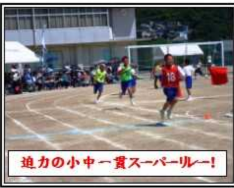
迫力の小中一貫スーパールー!

た「win」という文字を作ります。最初は何をしたらいいのか全く分からずすごく焦りました。でも先生の助けもあり、どうにか団長としての役割を一つずつクリアしていくことができました。でも、ソーランでは、一・二年生が声も出さず、動きも良くななく、団長をするのが辛かった時もありました。しかし、少しずつ僕たち三年生の思いが皆に伝わって、本番では引き分けだったけど、悔いなく終わること 【白組団長の感想】 僕は団長として、七つの資質・能力をより活用できた最高の運動会だったと思います。知識・技能では、主にソーランやリレーのバトンパスでした。ソーランでは、より迫力的に見せるために動きを考え実行しました。リレーのバトンパスでは、ノールックパスを心がけて美しいバトンパス