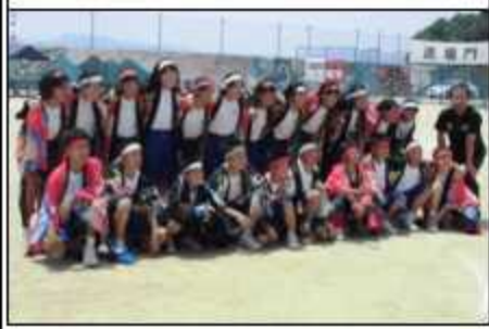
カー杯のソーラン後の1年集合写真!