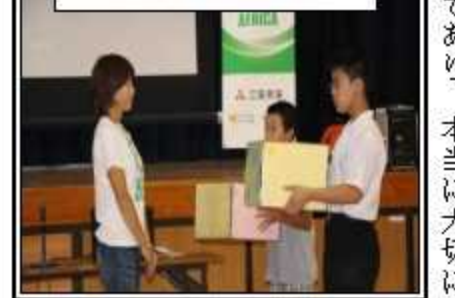
児童生徒代表による「運動靴贈呈」場面

裸足で生活(破傷風等の病気も発生)しているアフリカの子どもたちに贈る「スマイルアフリカプロジェクト」に本学園が参加したので、高橋さんの講演の中で、集められた靴が、アフリカの子どもたちにとって「宝物」であり、本当に大切に