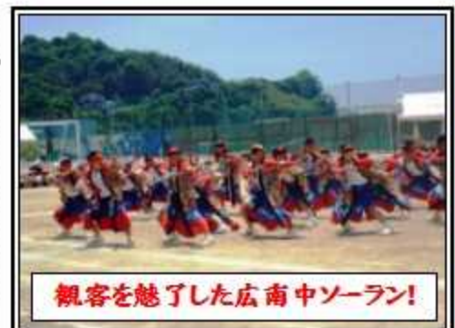
観客を魅了した広南中ソーラン!

ができました。それに、ある二年生の男子が、僕に「先輩の気持ちを引き継いで、僕が団長になります。」と言ってくれました。その時、今まで頑張ったことがちゃんと伝わっていると思い、感動しました。リレーでは皆しっかりとしたバトンパスをしていて、観客を魅了する演技ができたと思います。今回の運動会で団長をして、いろいろな事を学びました。例えば、協働的な態度で、皆が一つになった時の喜びや団長としてチームの代表としての責任・使命の大切さ、ソーランで難しいと思っ