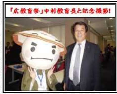
「広教育祭」中村教育長と記念撮影!

昨年、11月23日(木) 広教育祭での第2学年起業企画商品販売が、中村教育長の目にとまり、12月末の「呉市教育委員会訪問」が決定し、代表生徒が、「起業体験」について教育長の御取組発表を行ったところですが、今度は、この1月に、 キャリア教育優