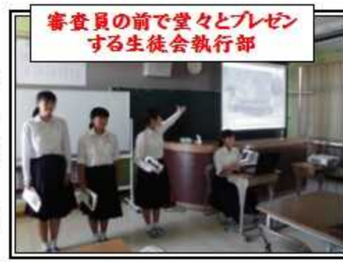
審査員の前で堂々とプレゼンする生徒会執行部

3月末の黄播山の地下工場見学をきっかけに、広南地区の戦跡について、3年生や文化活動部を中心に学びを続けてきました。その成果を形にするために創作