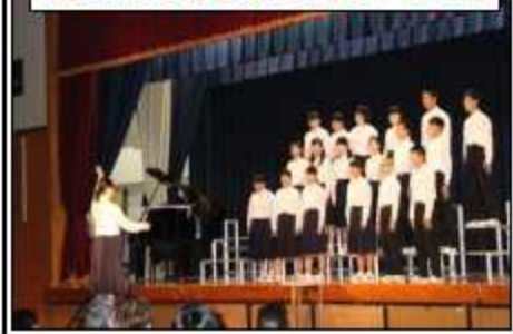
難曲「道」を決をこらえ熱唱！ 聴衆に感動を与えた【3年合唱】

約10万円もの利益があると知り、「本当に社会貢献できると自信になりました。商品が売れる時、売れていない物があつたら、「それ少し買つてあげようか。」と言つてくださる方や、「全部買つてあげるよ！」という地域の方もおられ、この企画の目的の社会貢献に対して地域の方が協力して下さっているのだと改めて思い、感謝する気持ちが強まりました。次は、「広教育祭」での販