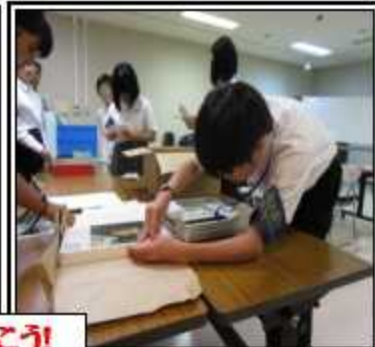
5日間の各事業所での経験を起業企画に生かしていこう!

・運動靴やスニーカーであること ・集める靴の条件としては、家族の靴でも大歓迎です。ば家の条件に合っていない活動です。自分の靴に限らず、次の条件に合っていない靴等を集めて届けることで、国際貢献しようという