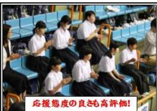
応援態度の良さも高評価!

呉・賀茂地区大会出場 おめでとう。どの部も次の大会に向け、日々の努力を大切にしてください。