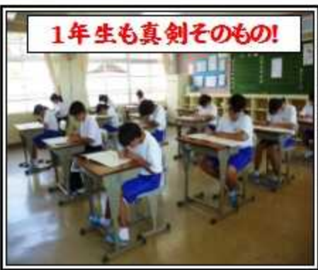
1年生も真剣そのもの!

生徒諸君、みんなの頑張りの陰には、保護者や地域、先生や教育委員会の支えがあることを忘れないでください。また、その多くの方の支えに応えるためにも、今後も「挑戦心や貢献心」を大切に！