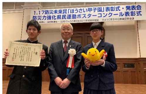
応募総数 118 点からの受賞でした。呉市からの受賞ははじめてです。