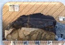
探究のシンボル「マローンストーン」