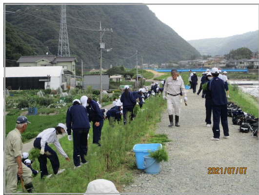
《7月7日の地域の方々と一緒に活動する様子》

・コスモスボランティアをやることによって、広の町がコスモスでいっぱいになり、みんなが元気になると思います。また、広の町全体が明るく元気な町、楽しい町になり、いろいろな人たちがコスモス街道を訪れると思います。