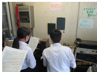
《放送室から総会を進める様子》