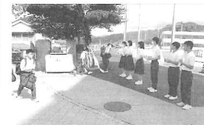
挨拶運動中の生徒会執行委員