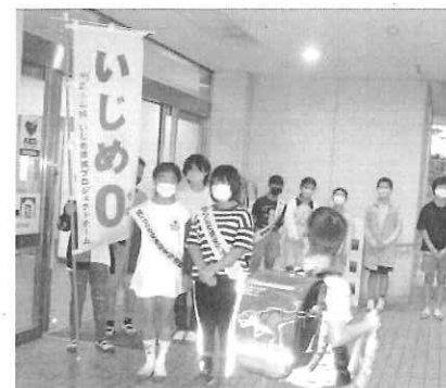
挨拶運動中の明立小児童