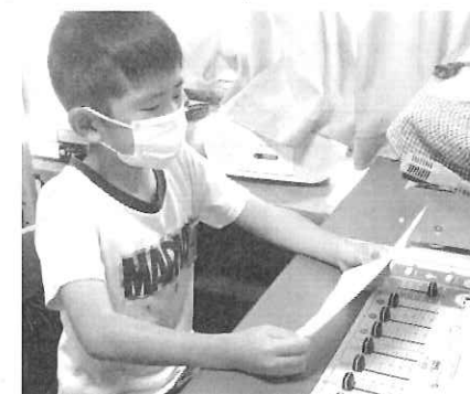
放送で呼びかけ中の原小児童