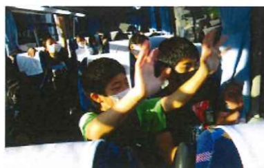
バスの中での態度や明るさにガイドさんも感激