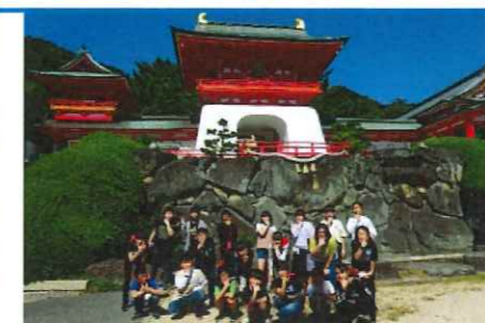
ポーズを取る時は思いきり笑顔で