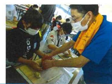
学ぶべきところではしっかり学んで