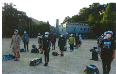
出発式の態度のすばらしさ

緊急事態宣言が無事解除となり、6年生は10月7日に予定通り修学旅行に出発することが出来ました。どの場面でも3つのねらいを達成するために頑張ろうという姿が見られました。