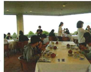
守るべきことはしっかり守る、黙食も完璧!