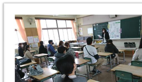
学級懇談会で各担任が説明している様子

本年度も、「ふれあい相談窓口」（毎月第3火曜日）を設けております。お子様のことで気になることがあれば、遠慮なく学校にご相談ください。電話番号 0823-71-7756