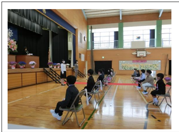
集中してお話を聞ける1年生です！