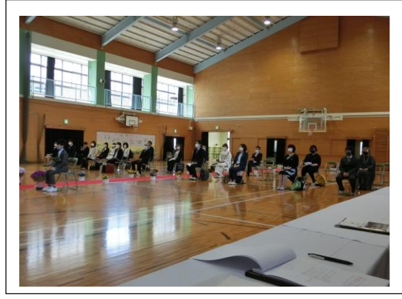
保護者の方々の厳粛な姿にも感激しました。