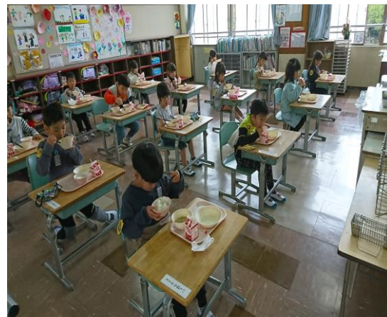
初めての給食です。感染症対策を守って1年生も黙って静かに食べています。