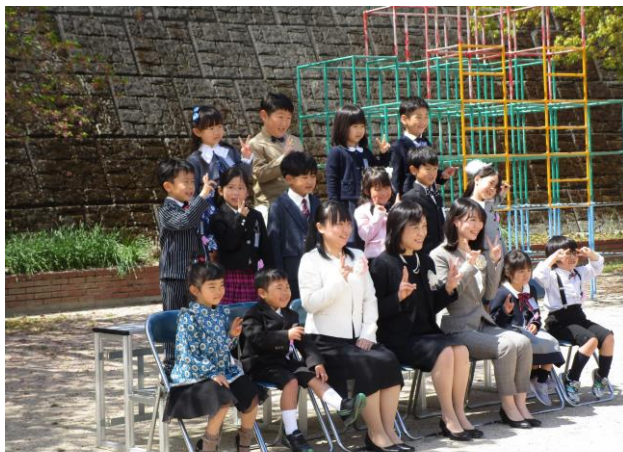
入学式が終わって1年生も先生もほっと一息