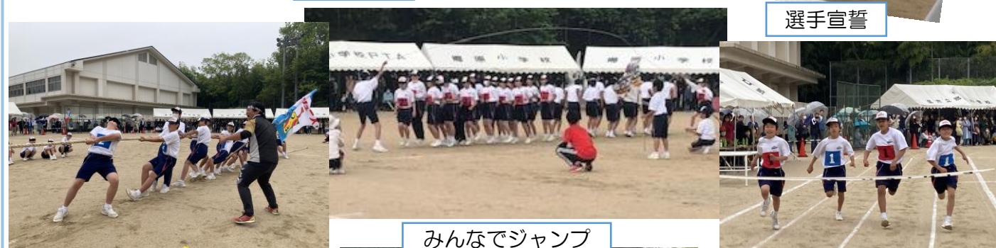
みんなでジャンプ