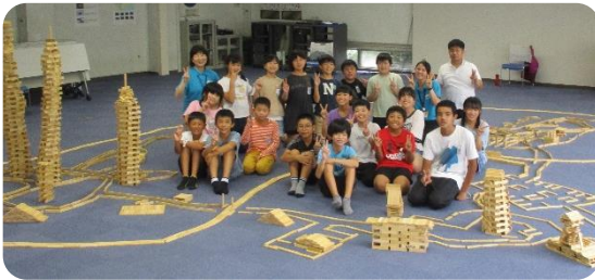
協力する大切さを学んだ カブラ体験