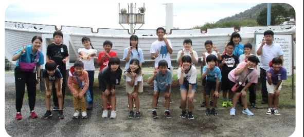
みんなで はい チーズ！