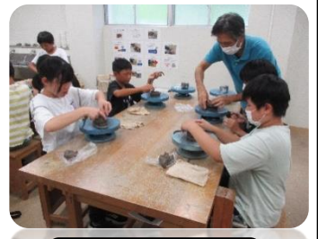
江田島焼きに挑戦