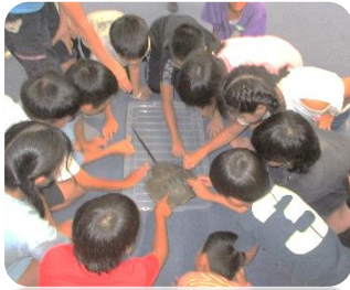
カブトガニをさわったよ！

2日間様々な体験を通して、「規律・切替・団結・思いやり・協力の心」を学びました。5年生の児童は指示されなくても自主的に考えて行動でき、どの活動でもとても立派でした。野外活動での学びをこれからの生活に生かし、ますます頼もしい安登小学校のリーダーになってほしいと思います。