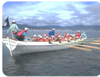
力を合わせたカッター研修