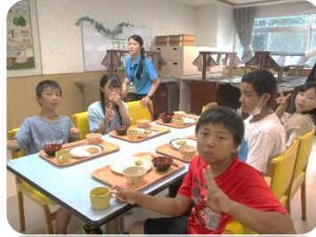
おいしい お食事タイム