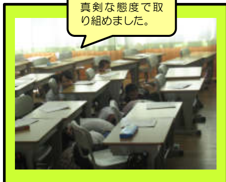
真剣な態度で取り組みました。