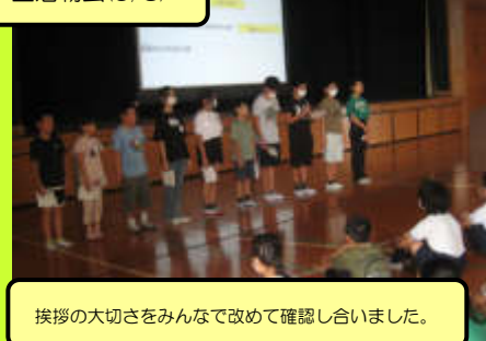
挨拶の大切さをみんなで改めて確認しました。