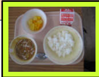
給食開始初日。どの学年も無言で落ち着いた態度で配膳をしていましたね！（9/4 3年1組で撮影）